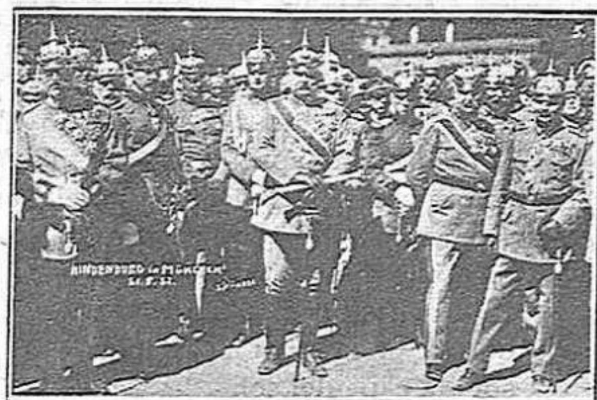
El militarisme a Alemanya després de la guerra

com el primer. Nosaltres, si es que volem parlar amb sinceritat, amb aquest nou militarisme no hi creiem.