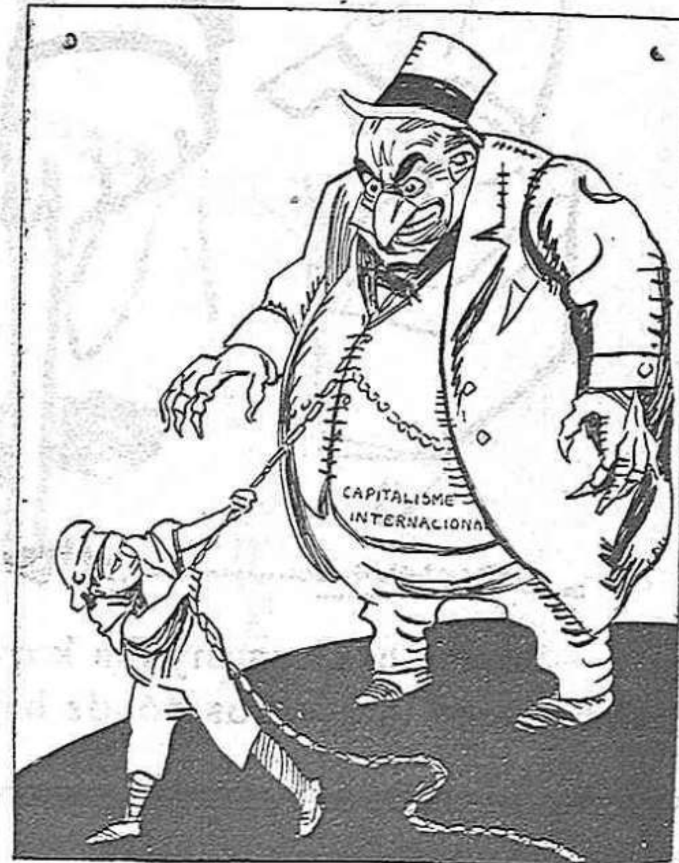
—Per a evitar els conflictes internacionals només hi ha un remei: aquest.

Igual succeïx amb els diners. Tindre grans quantitats de diners, esmerçar aquestes en quel-