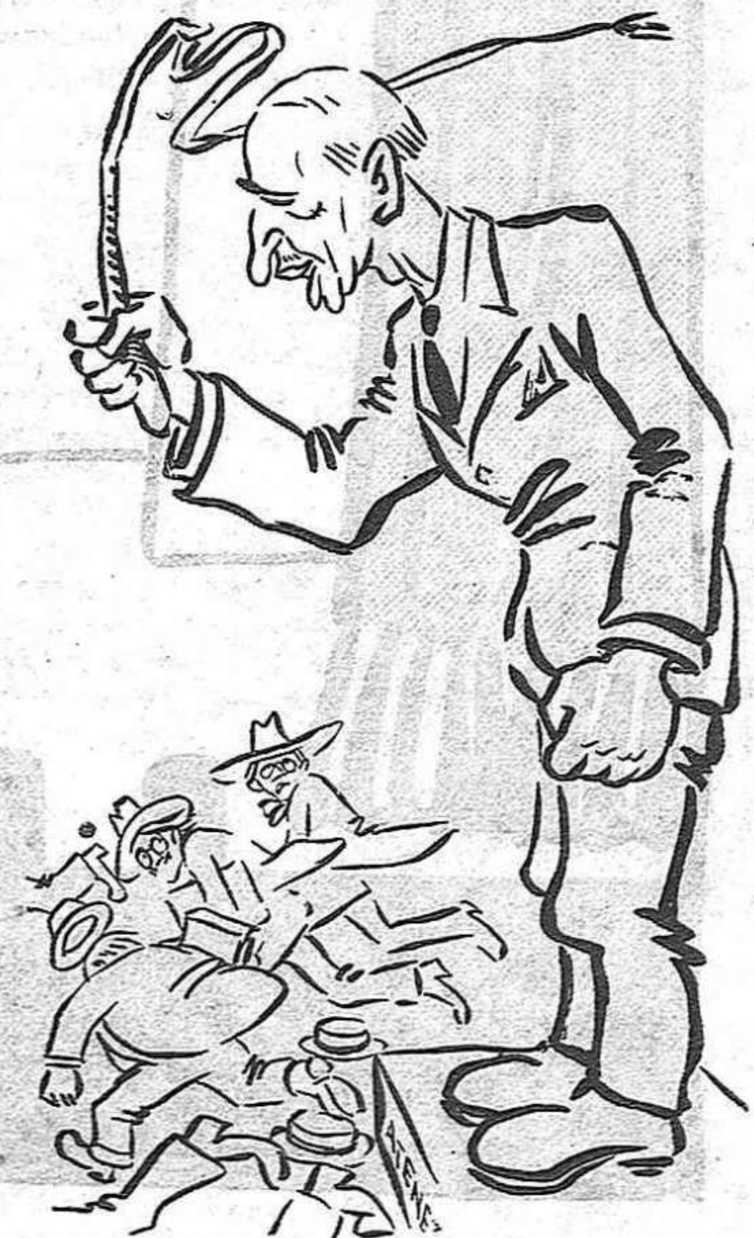
El gestic d'En Pestaña

Avui, aquí a Catalunya, ens trobem dins el camp nacionalista, amb la lluita