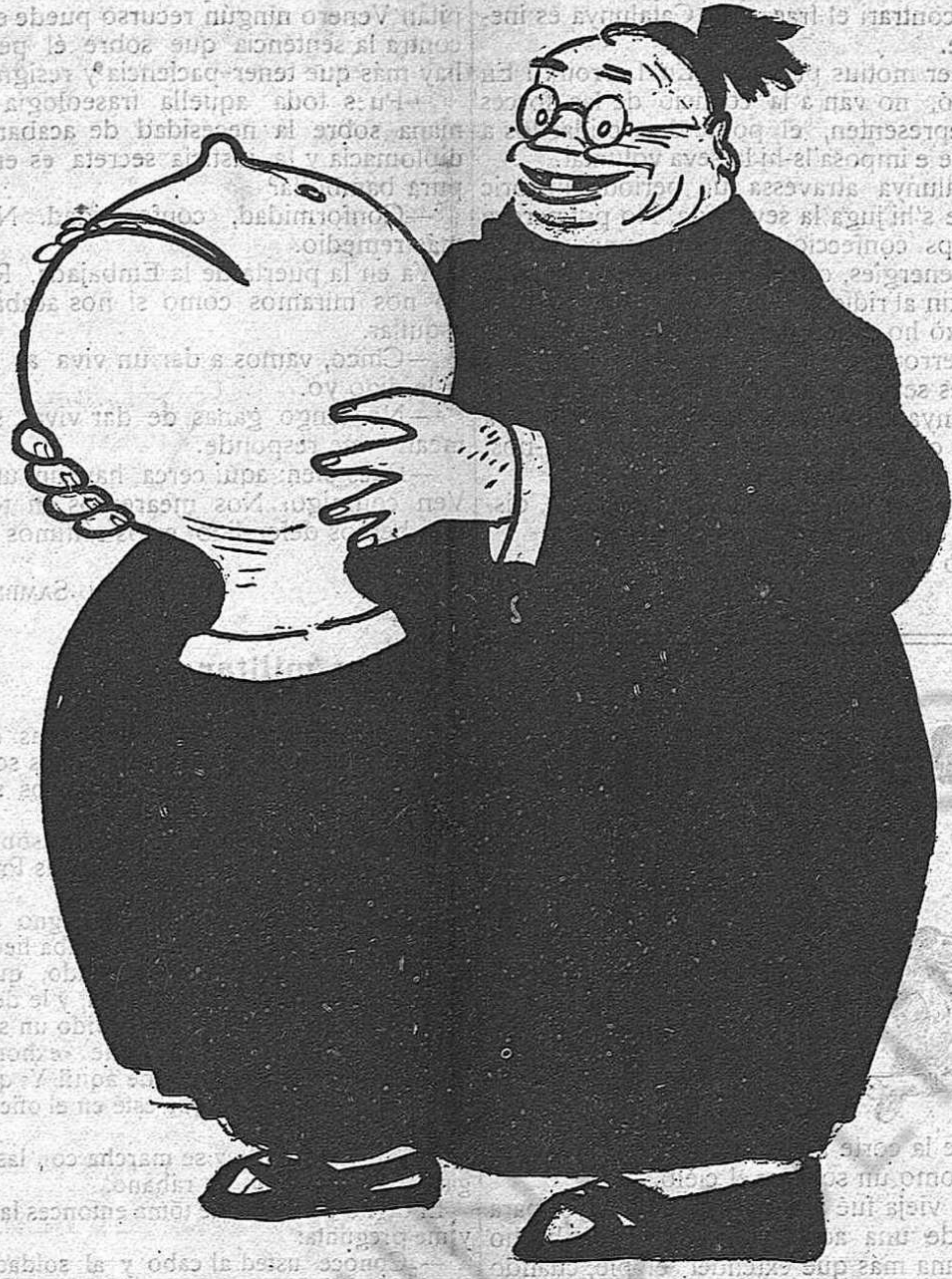
—Ansia, señores!... Un duro tirat aquí, és una ànima que surt del purgatori.