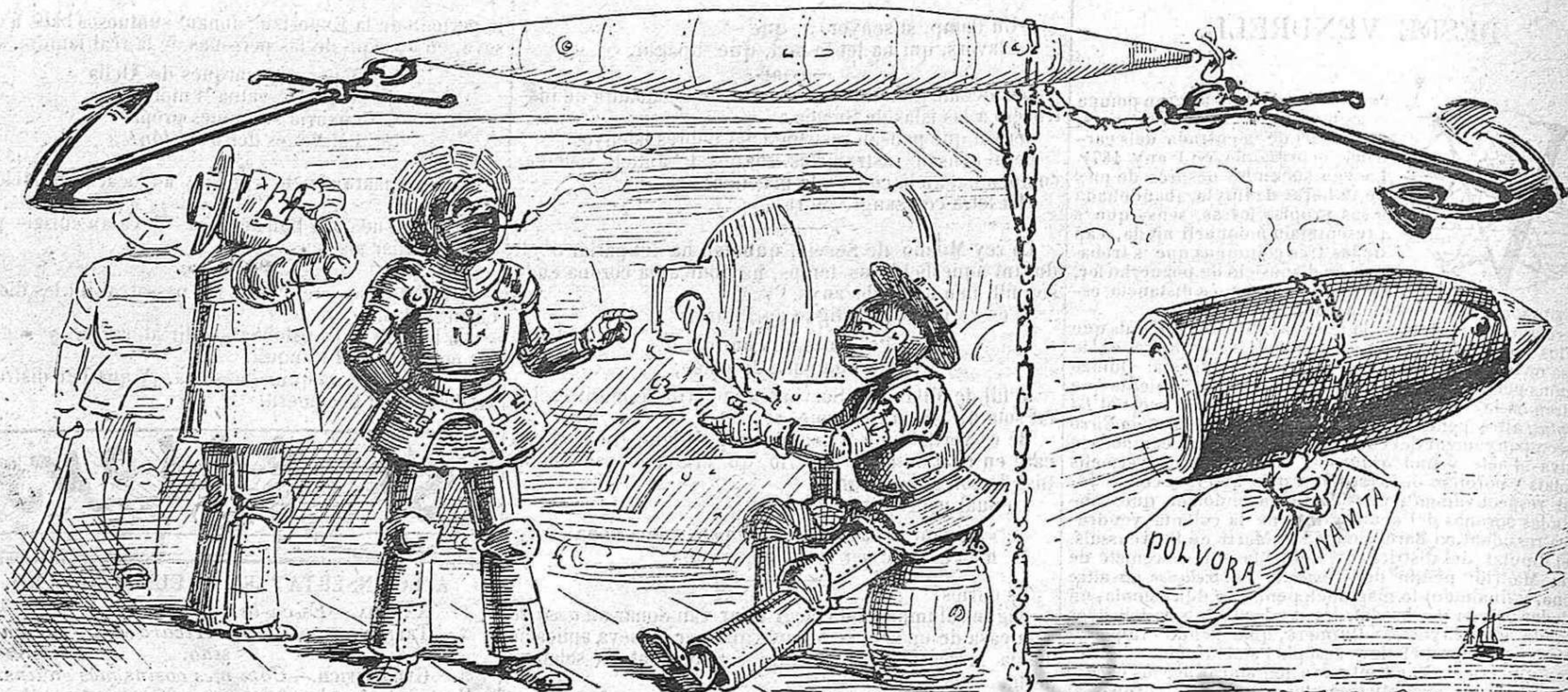
Los marinos haurán de anar acorassats per guardarse de la nova artilleria.