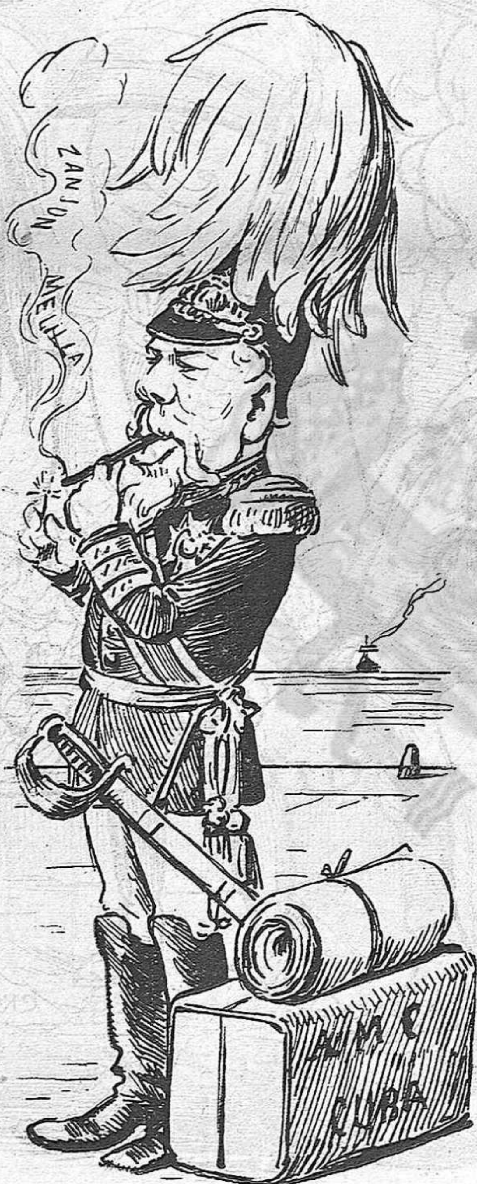
Y diuhen que hi torna à anà!

cohibir aquell progrés tant necessari com la creixensa natural ho es als sers orgànichs. Unicament la República pot reintegrar à Espanya en l' exercici lliure y respectat de la seva soberania, sense corruptelas electorals que desnaturalisin la voluntat de la nació, y l' obliguin à viure baix un règimen de falsedat, de immoralitat, de injusticia y despilfarro.