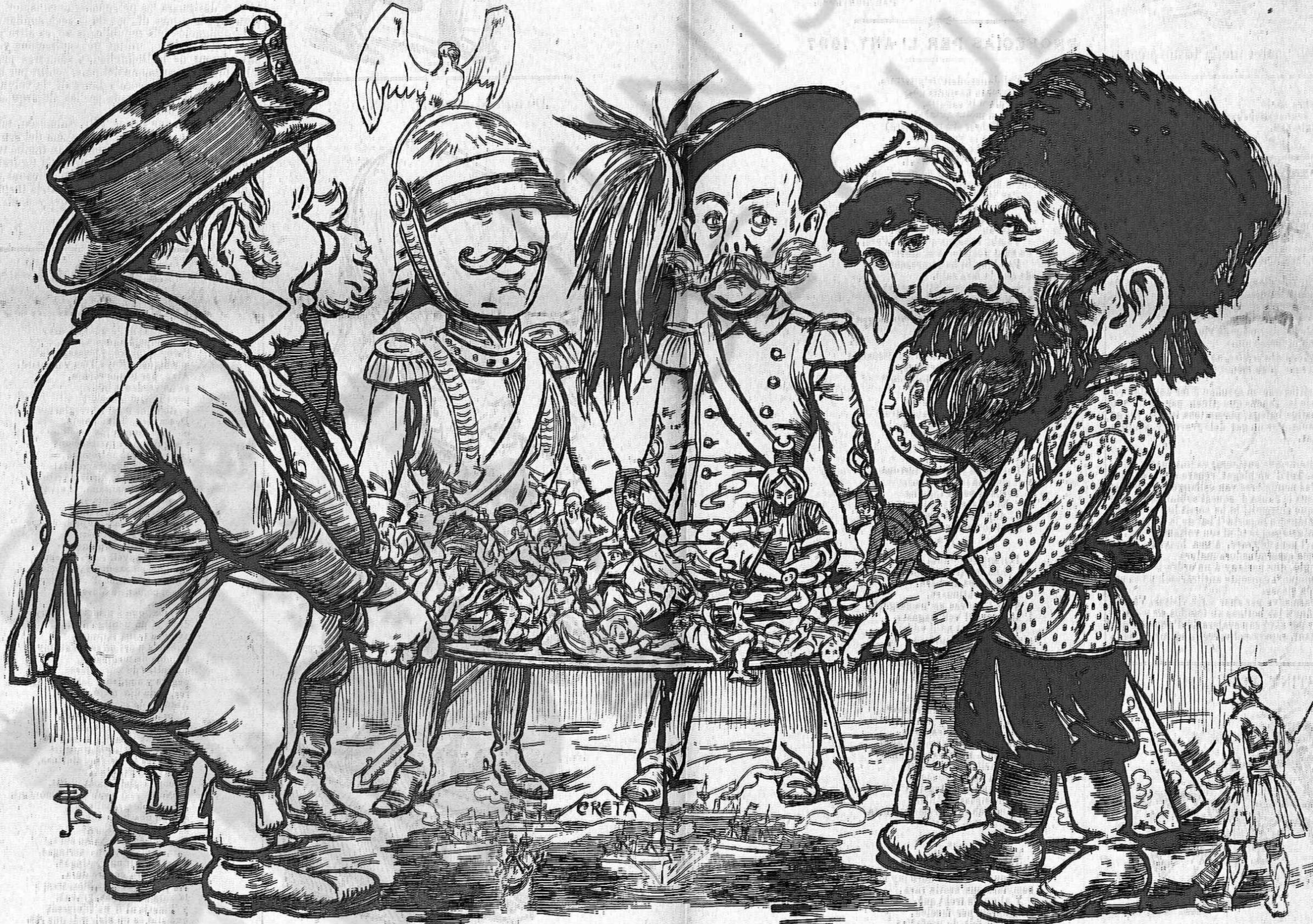
Las grans potencias cristianas d' Europa, sostenint lo statu quo.

M' olvidava de consignar un petit detall. Al barber del quento per últim se li descubriren las sevas malifetas y va morir penjat. En cambi al oncle Sam se li han descubert també, y se li permet que penjí a la pobra Espanya. Y encare hi ha espanyols que s' prestan a servir l' estira-sordetas.