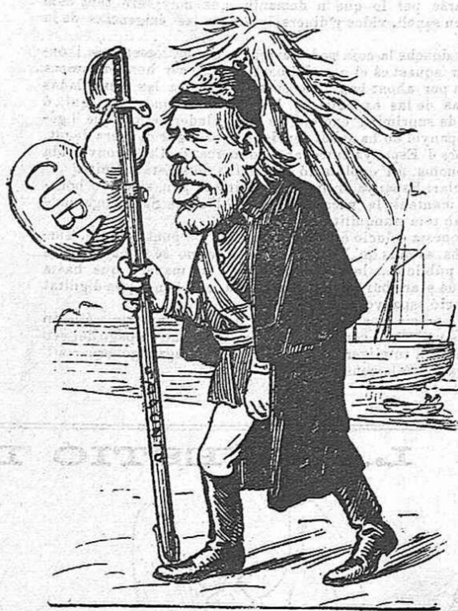
De aquest modo n' arribà.