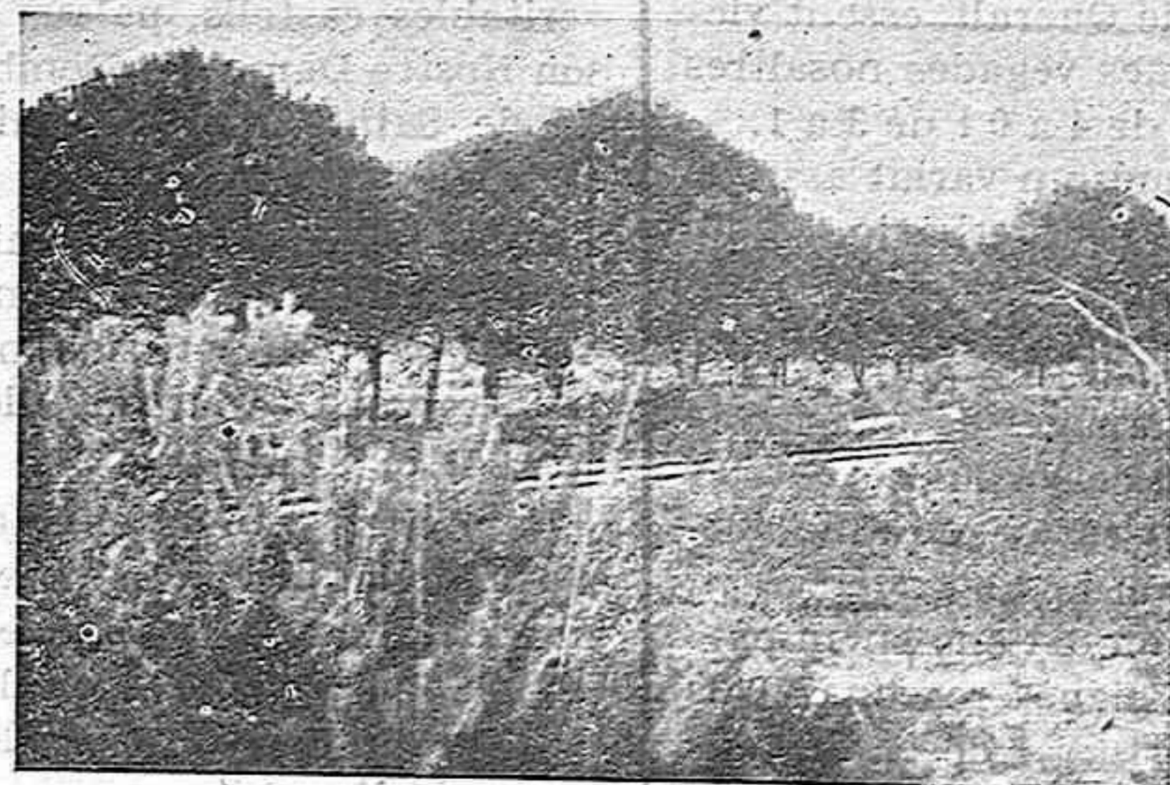
A Colònies, al mig dels boscos, i sota la volta del cel blau, els vostres cors elevaran amb més fervor les vostres pregaries al bon Déu.

Qui pot dubtar ja de l'eficàcia en la formació integral dels nostres