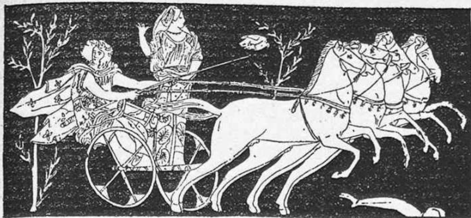
Pélope llevándose a Hipodamia en la cuadriga