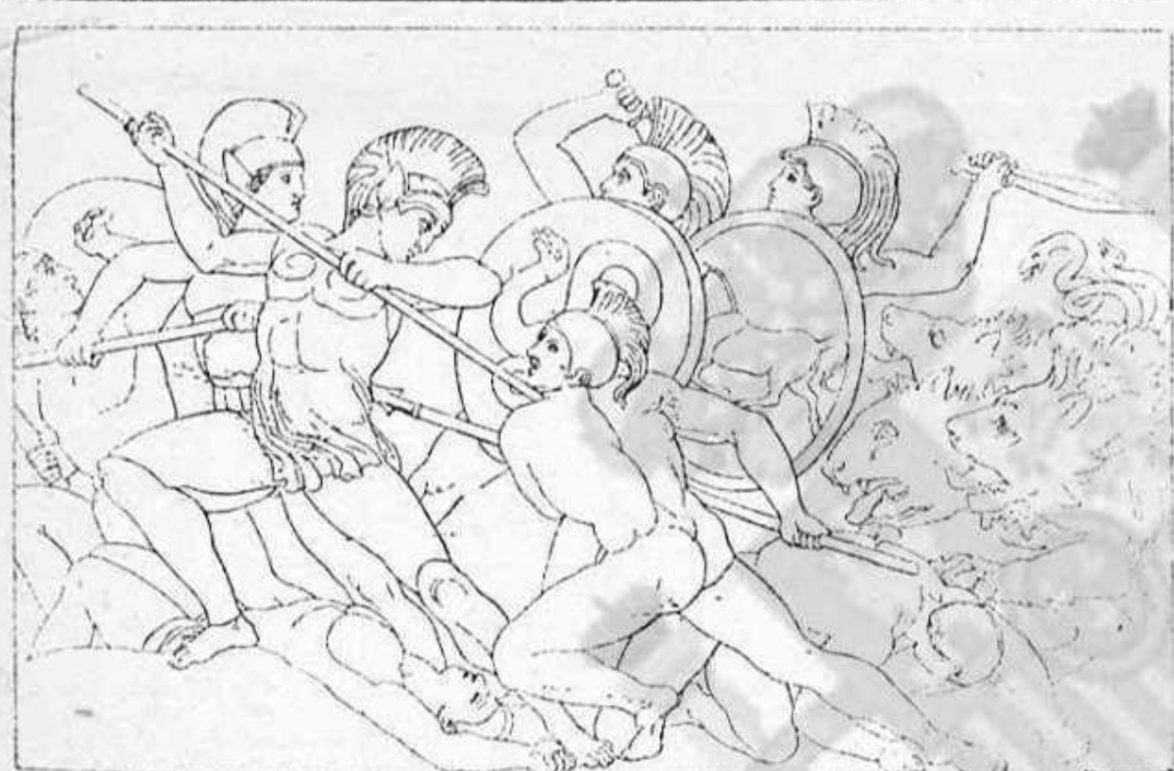
LA EDAD DE BRONCE Dib. de Flaxman

HOMERO: La Batracomiomaquia . HESÍODO: Los Trabajos y los Días . APOLONIO: Las Argonáuticas .