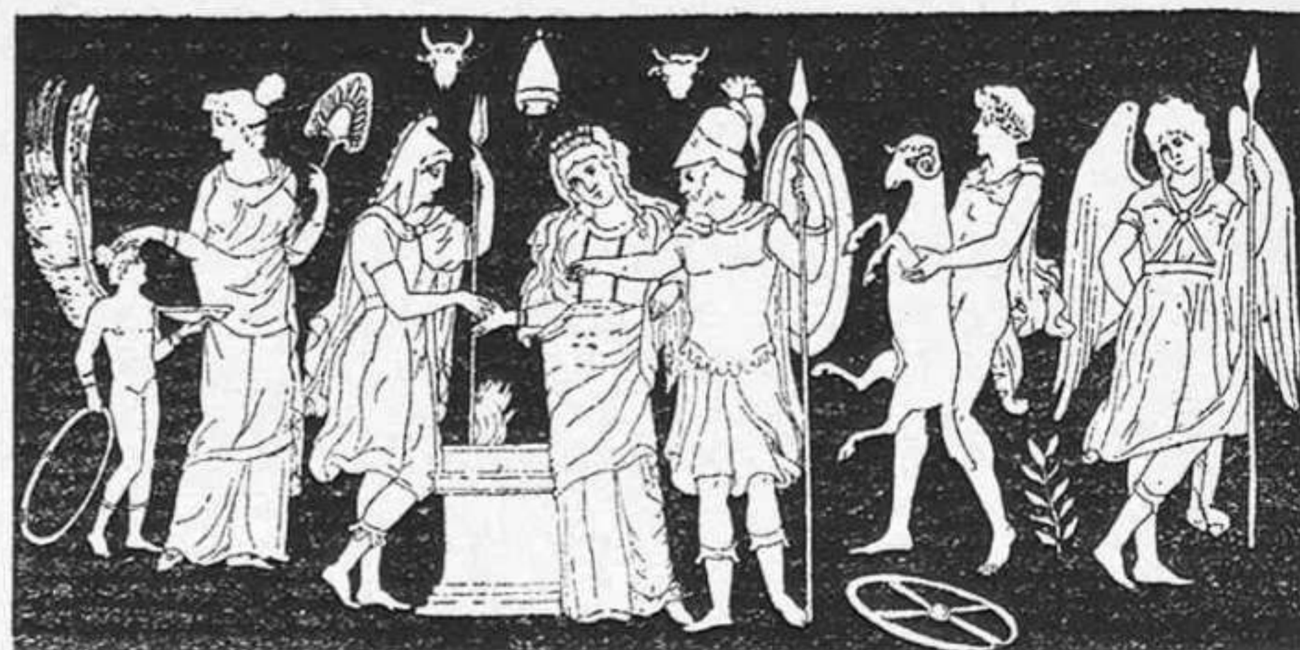
Pélope concierta con Enomao é Hipodamia las condiciones de la carrera