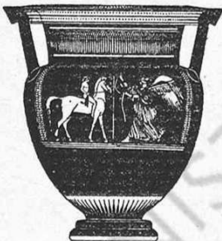
La Victoria premiando al jinete vencedor

PROFESORES DE LA UNIVERSIDAD DE BARCELONA