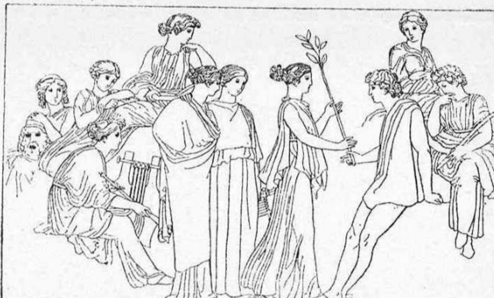
LA TEOGONÍA DE HESÍODO.—Hesiodo y las musas Dib. de Flaxman