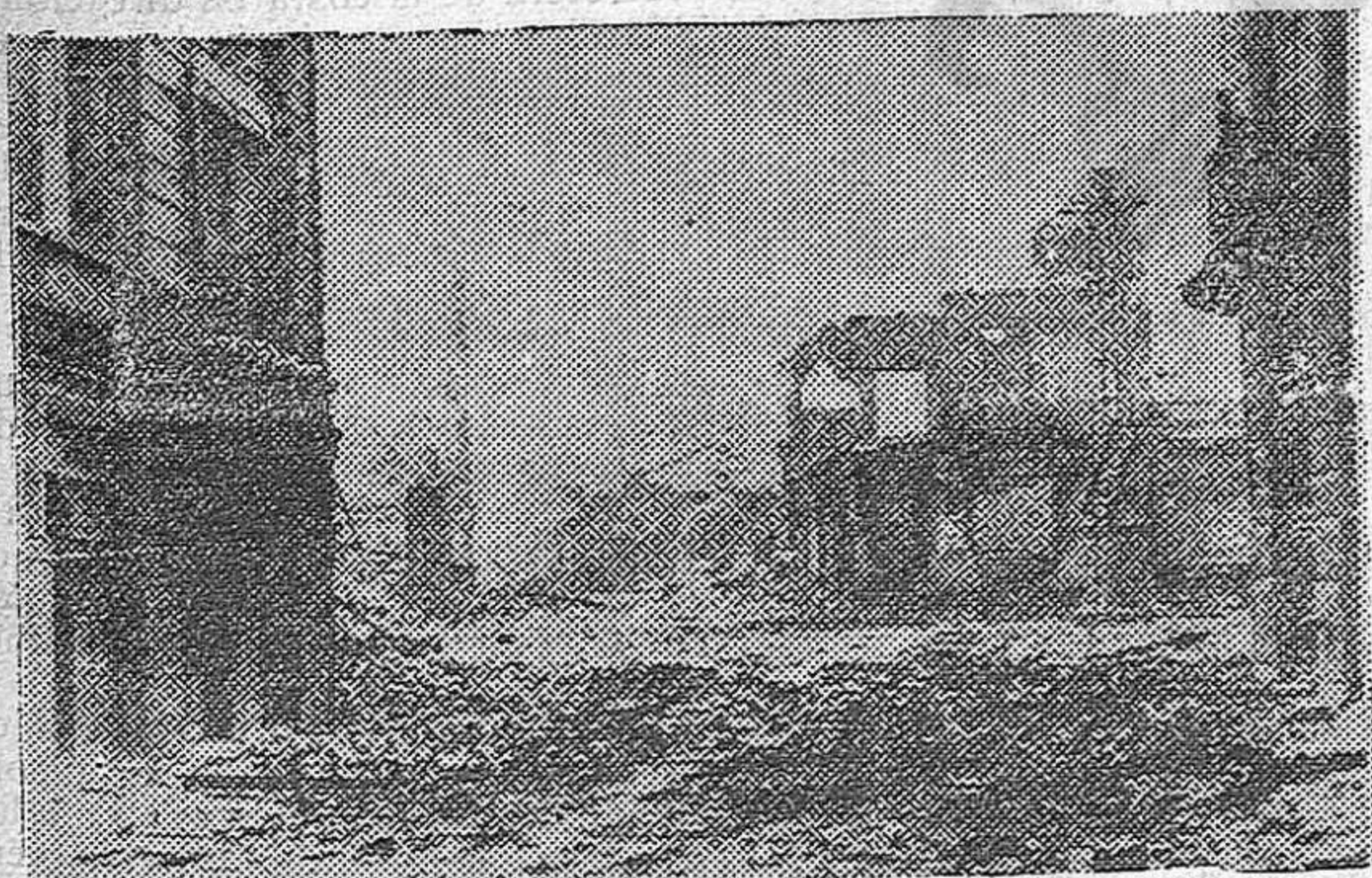
GUERNICA: Otra «heroicidad» del conglomerado rojo-separatista en sus continuas y recientes derrotas. Así dejaron el pueblo de las tradiciones vascas al emprender la huida hacia Bilbao