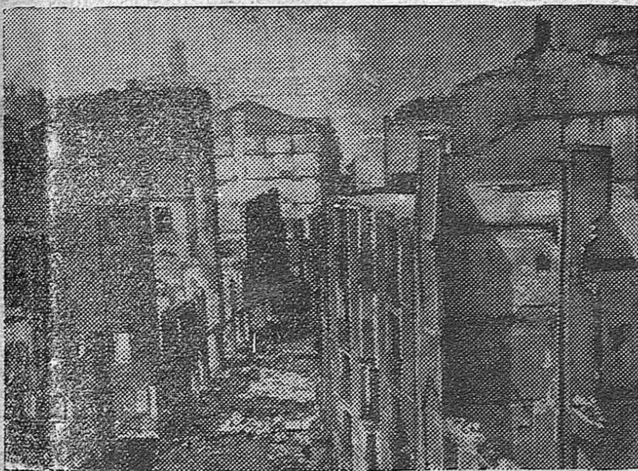
La bella fisonomía de las calles de Eibar tienen en la actualidad este aspecto de la presente fotografía. Al ser liberada la villa por nuestras tropas sólo cabe un comentario a estas fechorías rojas: Por aquí pasaron ellos.