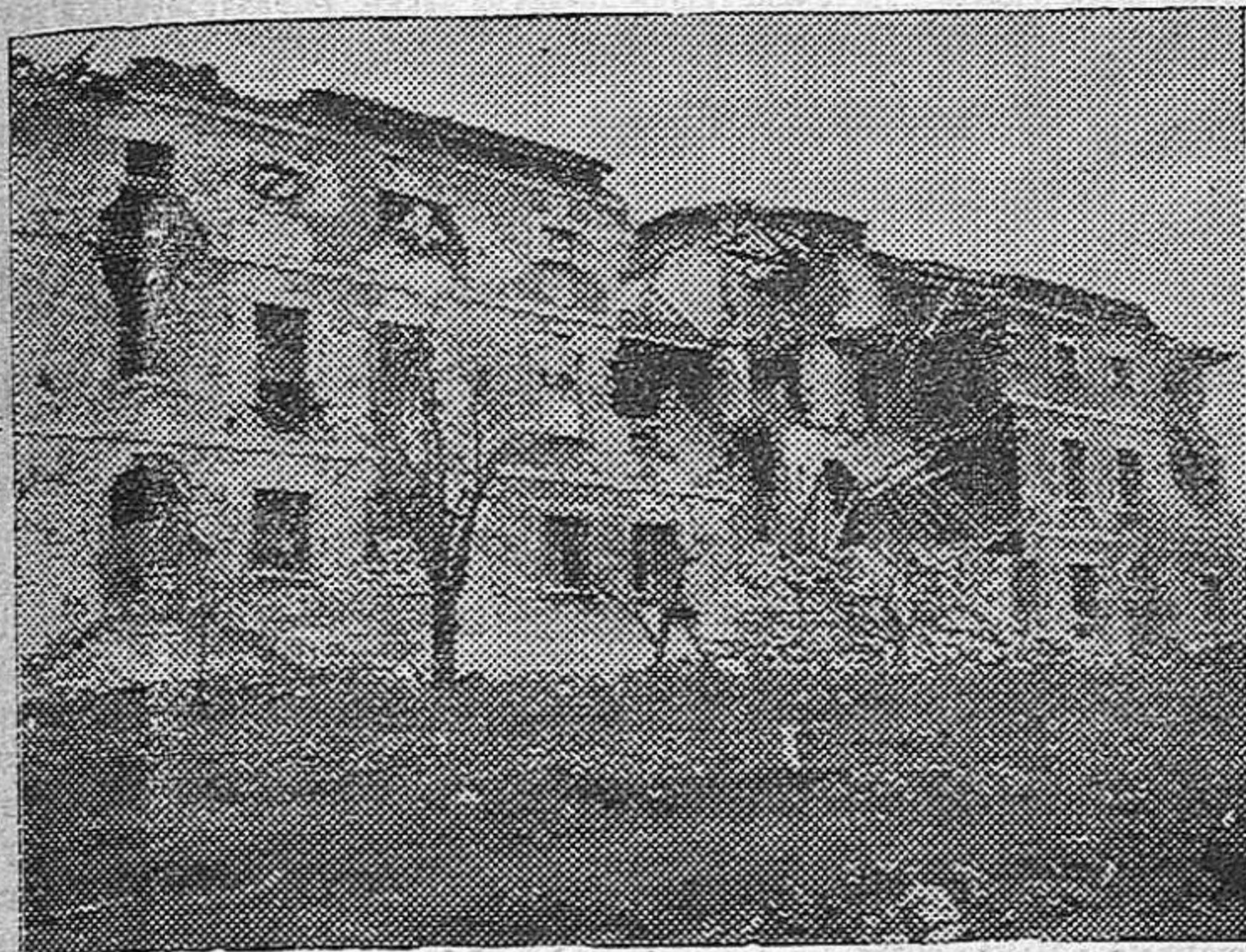
Antes de abandonar Amorebieta los rojos separatistas incendiaron sus calles para que no pudiera ser aprovechado lo que ellos no supieron defender gallardamente