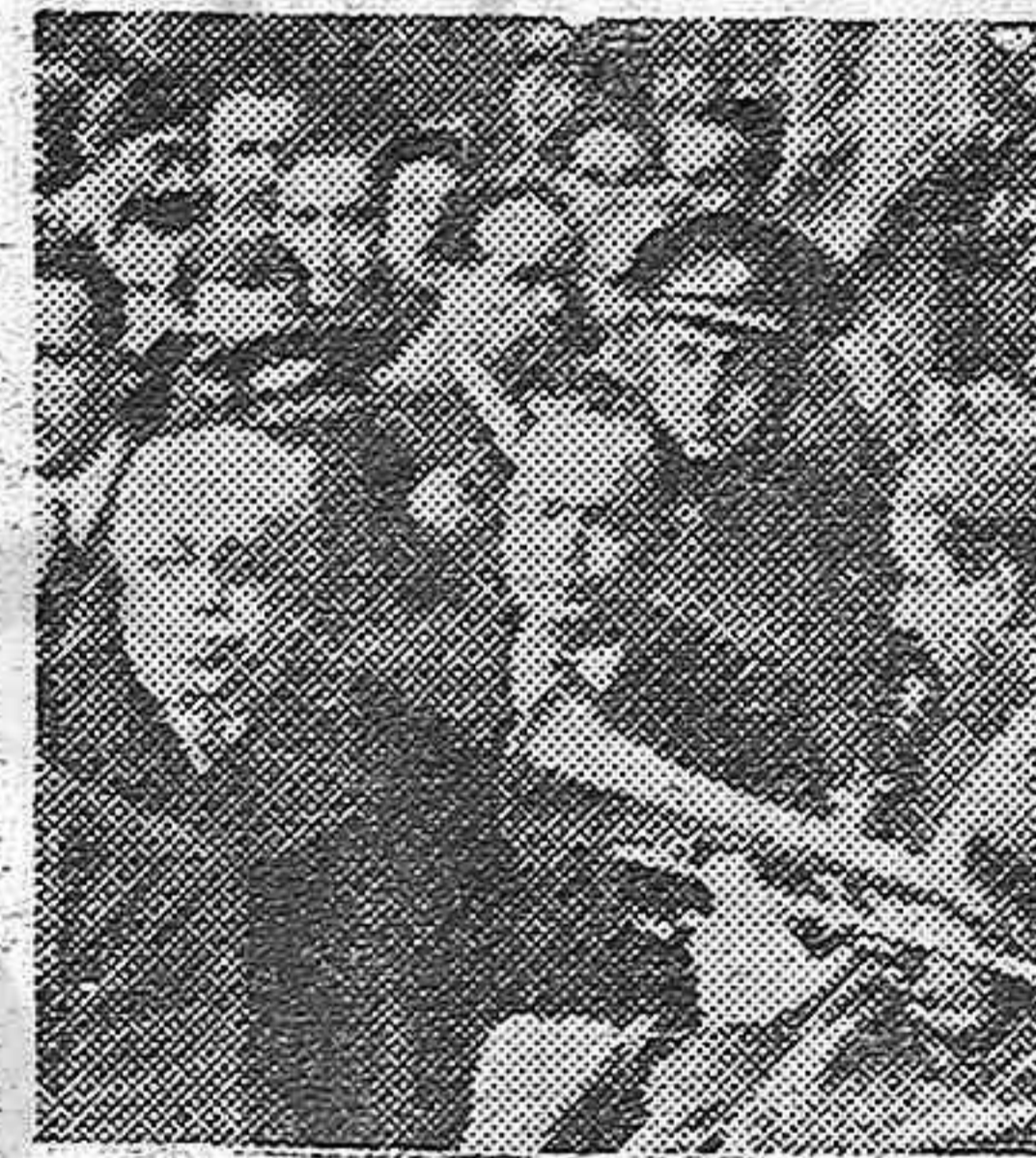
En medio del bullicio y del jolgorio, no parece que a Azaña le haga mucha gracia el trompetín. ¿Si lo estarán mandando al corral?...

Saludo a Franco, Arriba España! El Jefe Provincial del Movimiento.