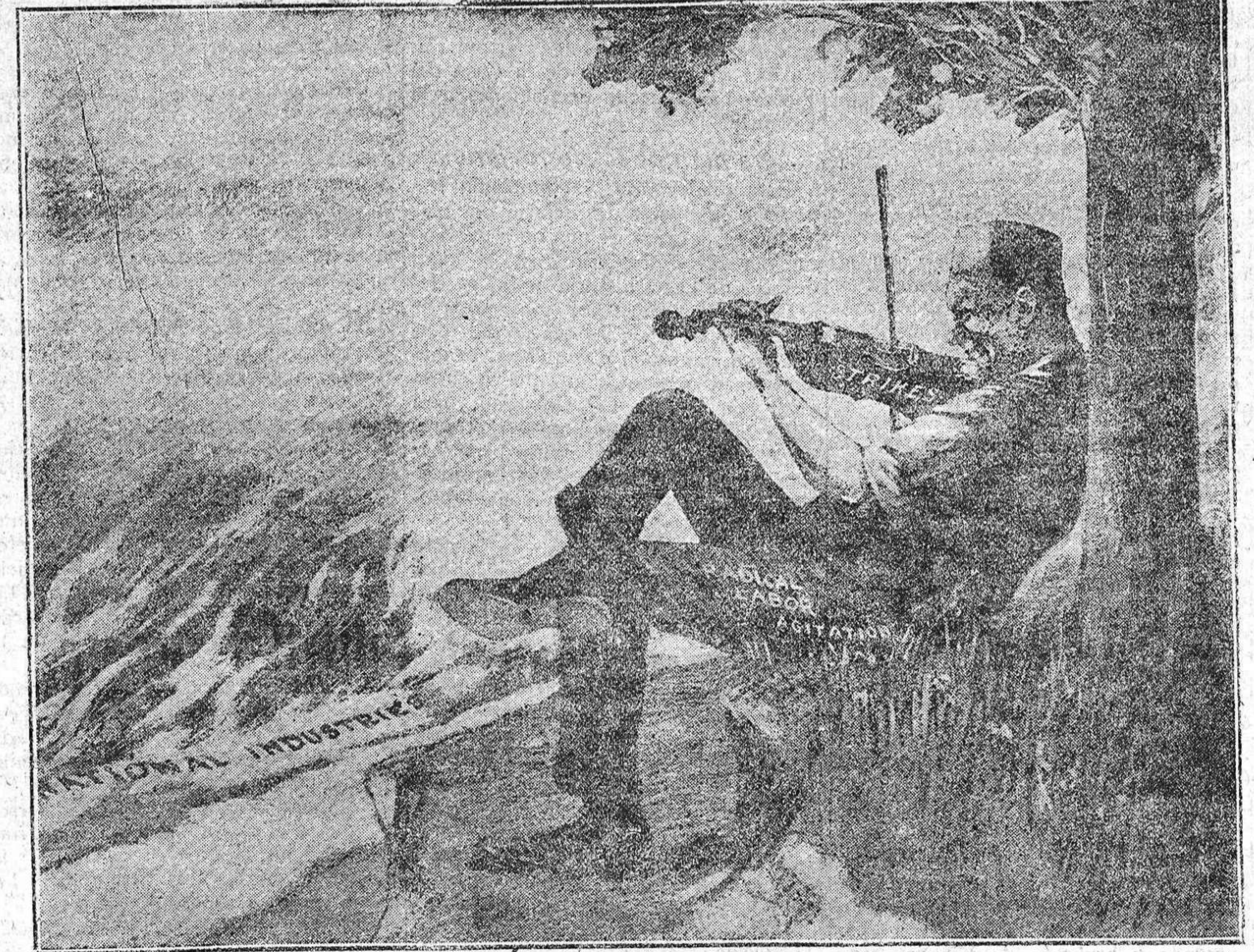
Mientras las industrias nacionales son presa del incendio, el moderno Nerón improvisa en el violín de la huelga el himno de la agitación demagógica. (Del New York Times Magazine)