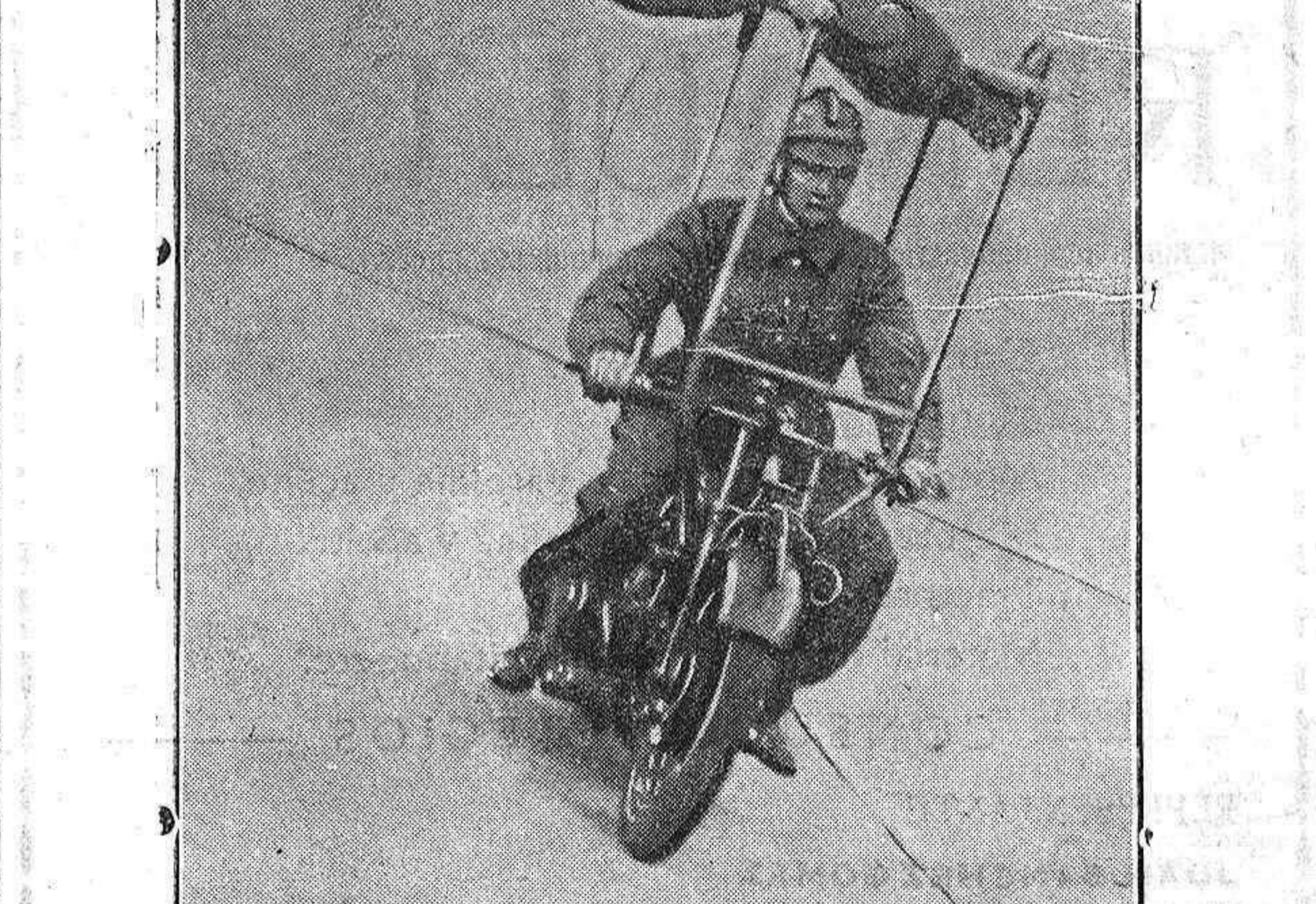
En un desfile militar, una compañía de motociclistas de Reichswehr ha practicado ejercicios absolutamente acrobáticos. Como puede observarse en esta ilustración.