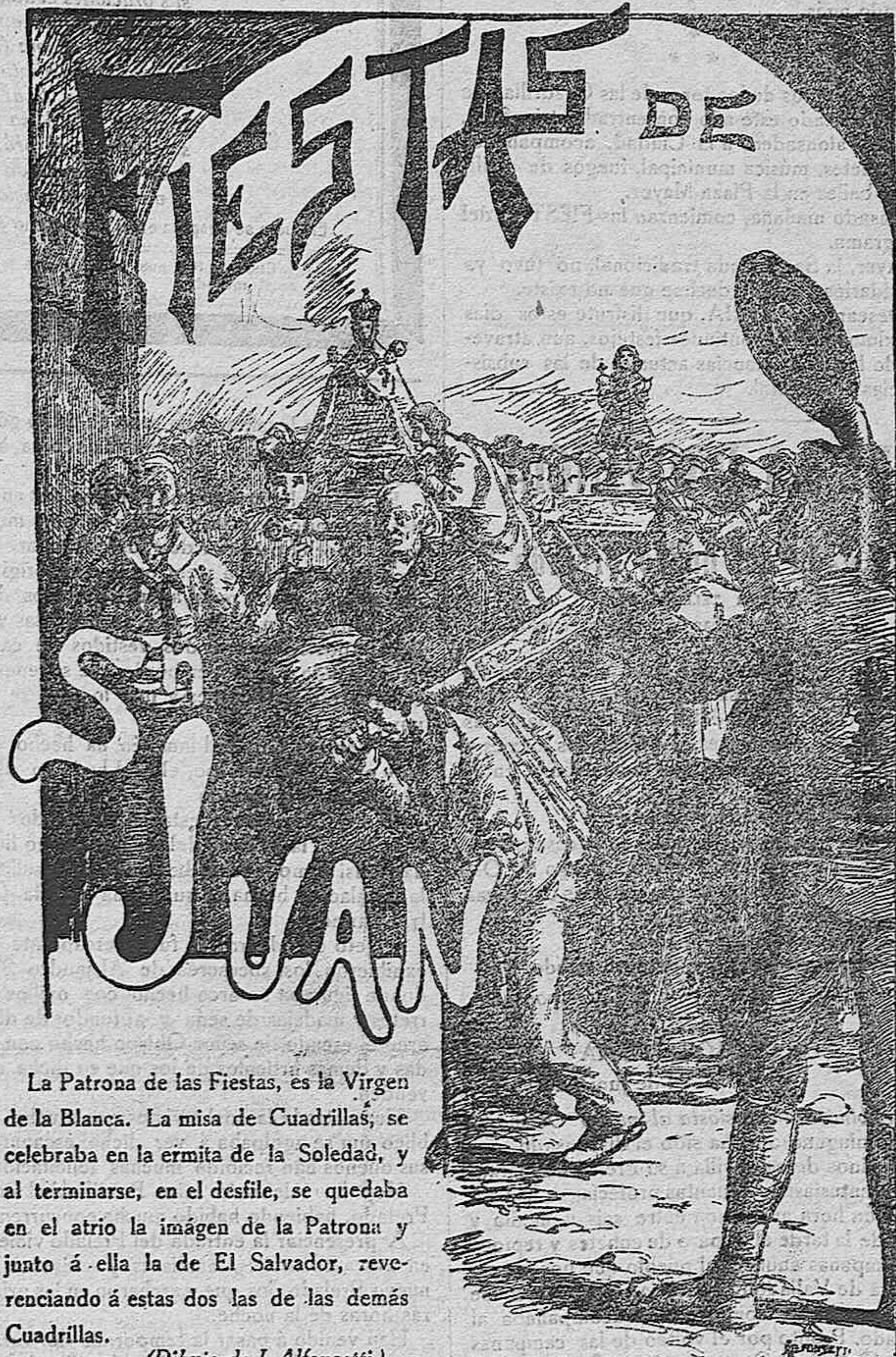
La Patrona de las Fiestas, es la Virgen de la Blanca. La misa de Cuadrillas, se celebraba en la ermita de la Soledad, y al terminarse, en el desfile, se quedaba en el atrio la imagen de la Patrona y junto á ella la de El Salvador, reverenciando á estas dos las de las demás Cuadrillas.

Nada creemos necesario recordar respecto á la tramitación, por decirlo así, que su celebración lleva consigo pues es bien sabida de todos los Sorianos y aun de los que no lo son. Lo que no podemos pasar en silencio y sobre lo que llamamos especialmente la atención de nuestros lectores, es el mecanismo, puede decirse en que descansan, y que viene á constituir su organismo particular por no decir original. Tal es el cuerpo de Jurados ó Alcaldes de barrio, Jefes superiores de las que se llaman Cuadrillas (colaciones antes, barrios ahora) en que la población está dividida para este acto y aun para todos los que se refieren á la administración municipal y económico administrativa. De todos modos para el asunto que nos ocupa se reúnen por su propio impulso si bien con el beneplácito del Ayuntamiento, para acordar y disponer las fiestas, ajustar sus cuentas, crear fondos y demás concernientes á ellas; de todo lo cual se ocupan en unión de los vecinos de su respectiva cuadrilla ó barrio, á quienes convocan particularmente en los casos