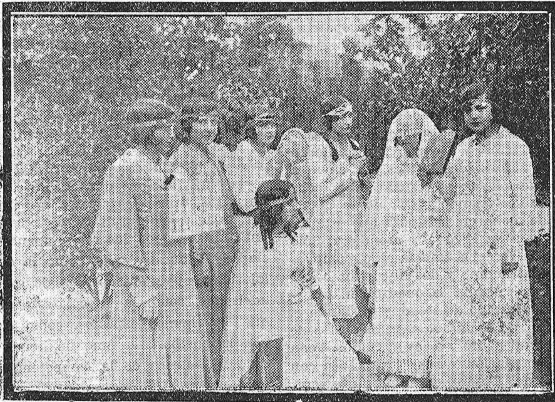
EN EL CENTRO FILIPENSE.—Precioso conjunto que forman un grupo de señoritas del Centro Filipense, en la velada del Colegio

Al sepelio acudió muchísimo público, abundando el elemento popular cordobés, entre el que la difunta tenía grandes simpatías.