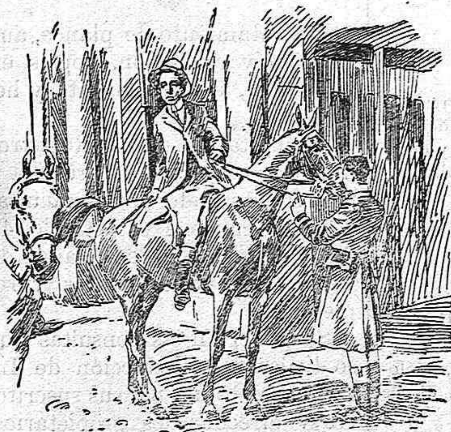
El rey preparándose para dar un paseo á caballo.