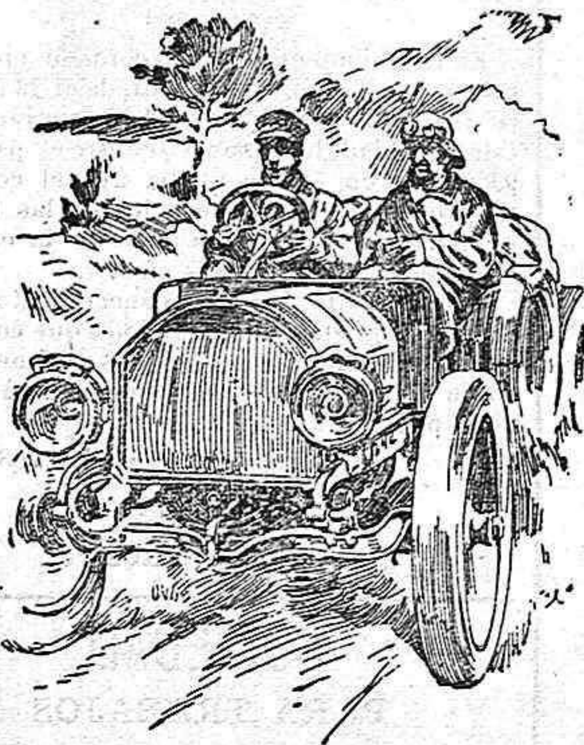
Su Majestad el Rey D. Alfonso XIII paseando en automóvil por la carretera de la Granja á Riofrio.