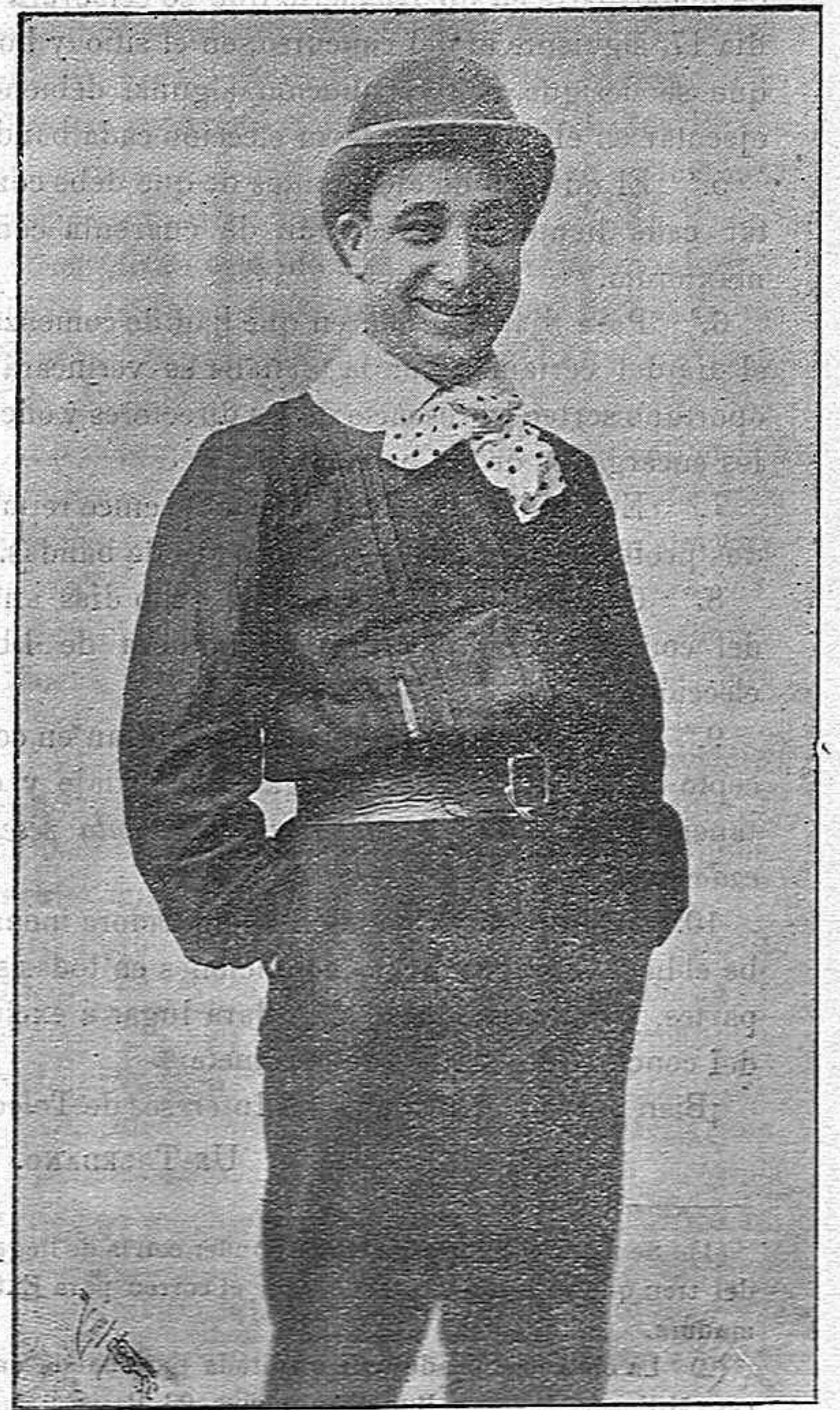
En Agencia Artística.