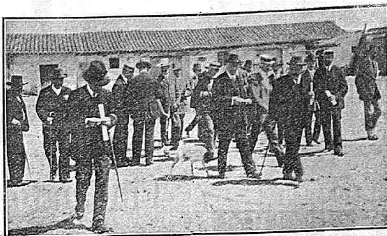
Alumnos y sus Jefes saliendo de la casa de LA ALBERQUILLA para realizar prácticas catastrales en dicha finca.