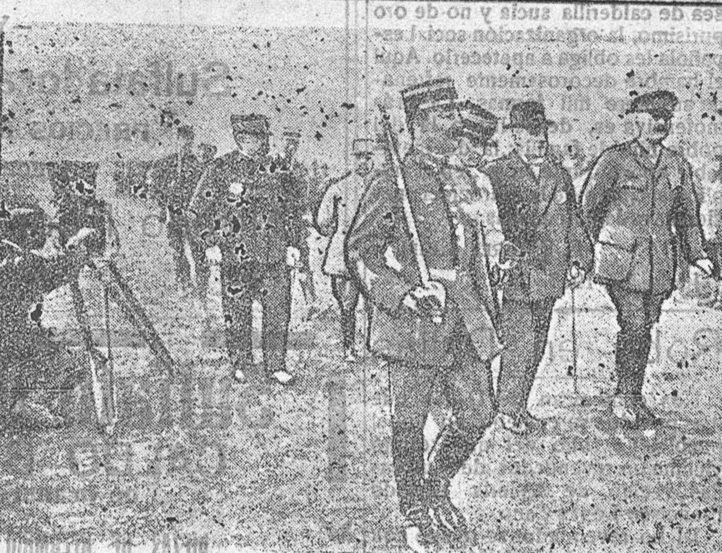
MR. SHARP, EMBAJADOR DE LOS ESTADOS UNIDOS EN PARÍS, REVISANDO A LOS AVIADORES NORTEAMERICANOS QUE OPERAN EN FRANCIA