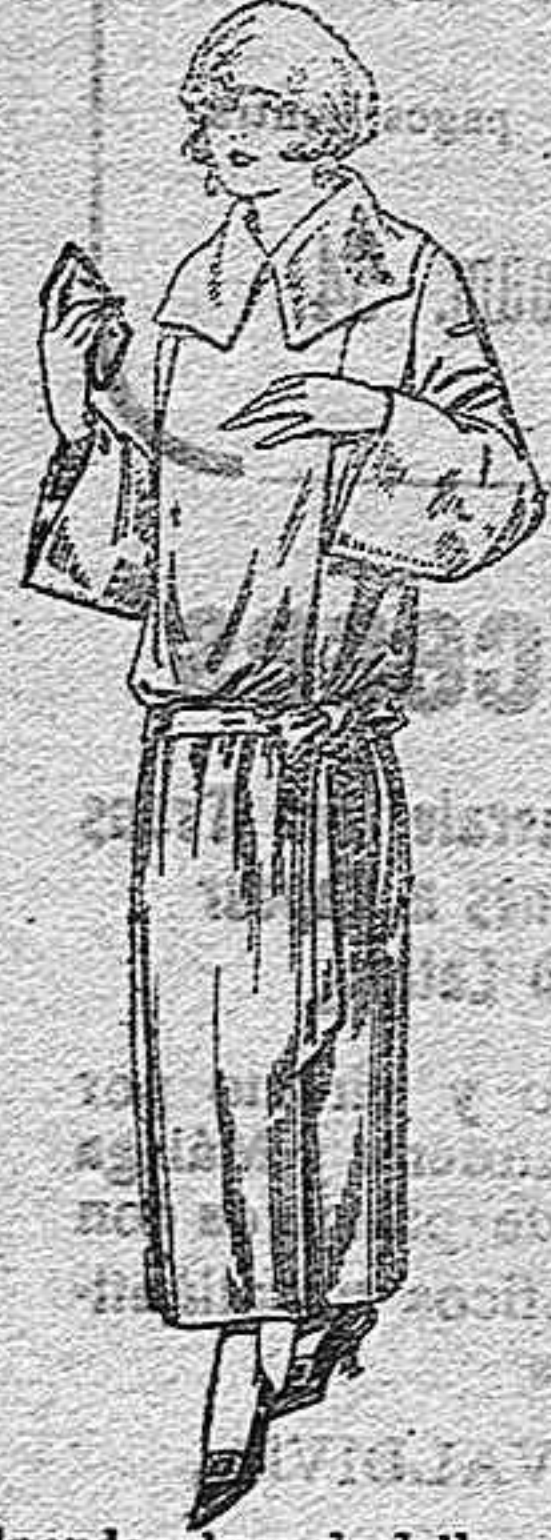
Guardapolvos de drill crudo, gris, beige, etc. de pesetas 18 a 25.