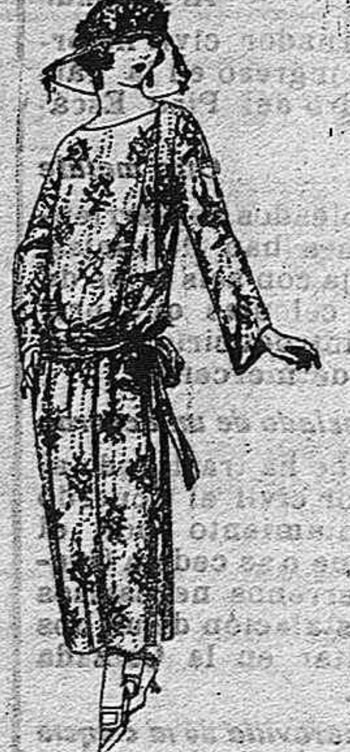
Vestidos de voile de algodón dibujos novedad, a ptas. 60

Ropas confeccionadas para caballero, señora, niño y niña.