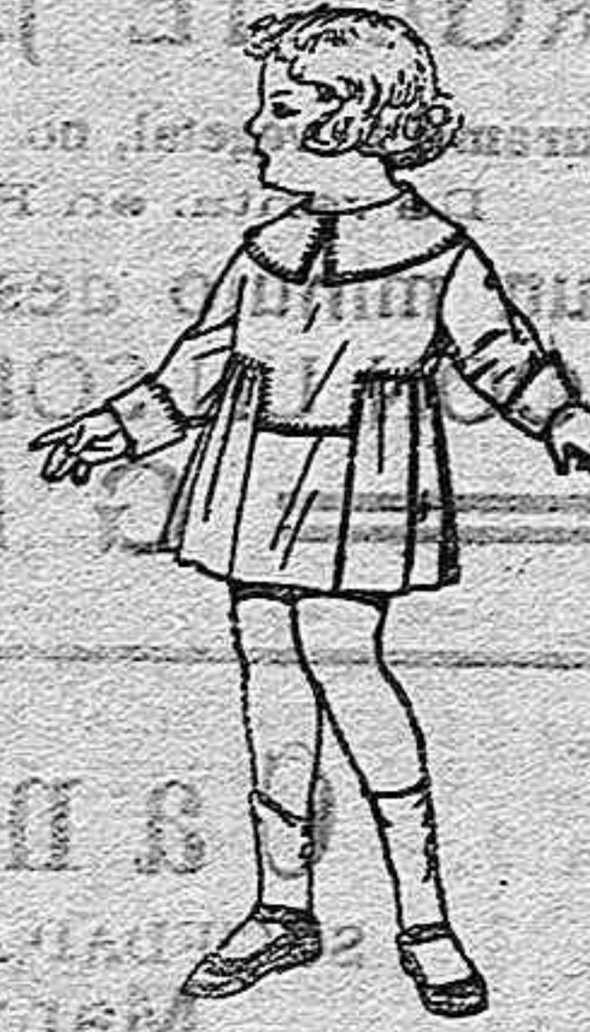
Vestidos batista blanca, pespunte de adorno para niñas de 3 a 6 años, de ptas. 5.50 a 6.50