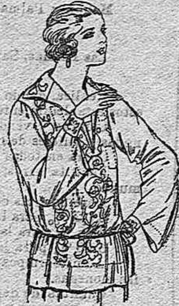
Blusas de voile de seda, en negro y blanco, adornos bordados, a ptas. 22