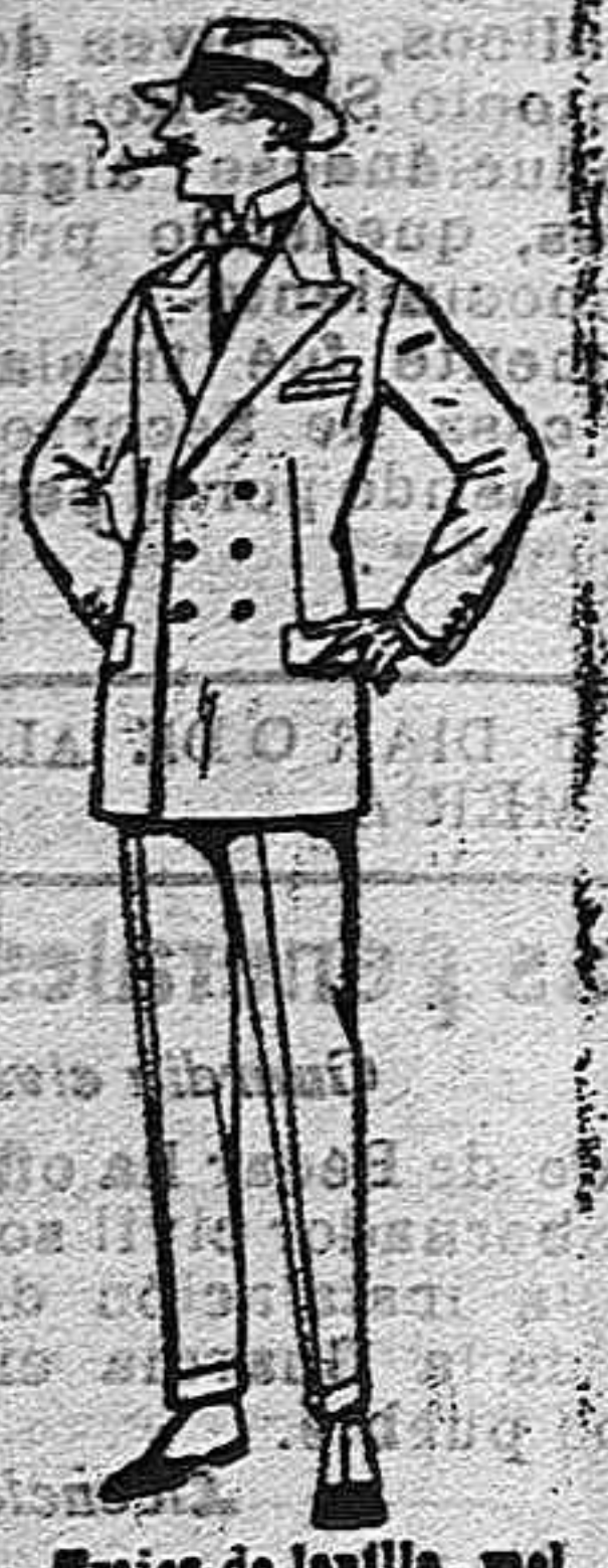
Trajes de lanilla, malton, estambre, vicuña o jerga, de ptas. 60 a 140