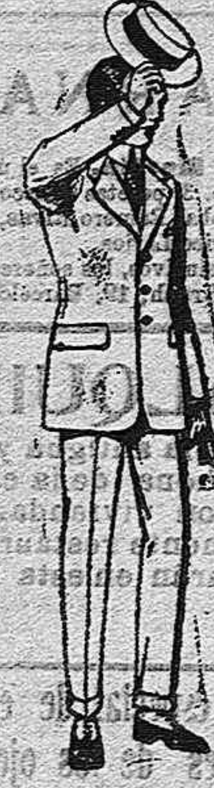
Trajes modelo Sport de lanilla melton, de ptas. 75 a 100.