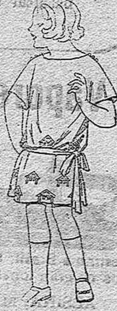
Vestidos popeline, sarga inglesa, etc. adornos bordados para niña de 4 a 6 años, de ptas. 30 a 35.