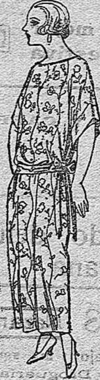
Batas de crepon, en negro y colores, adornos, bordados, de ptas. 32 a 55