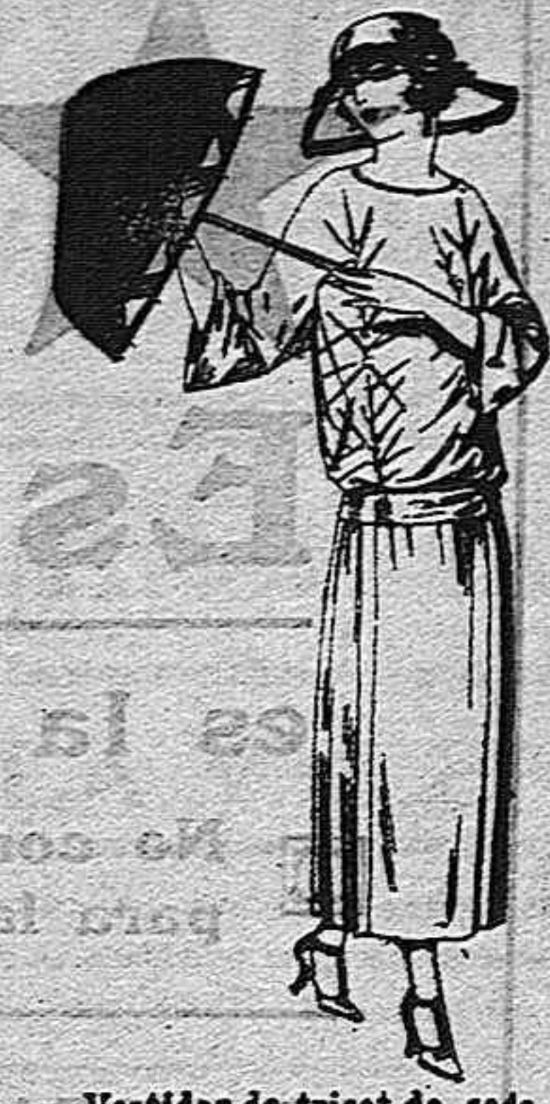
Vestidos de tricot de seda en negro, azul y colores moda, adornos bordados.