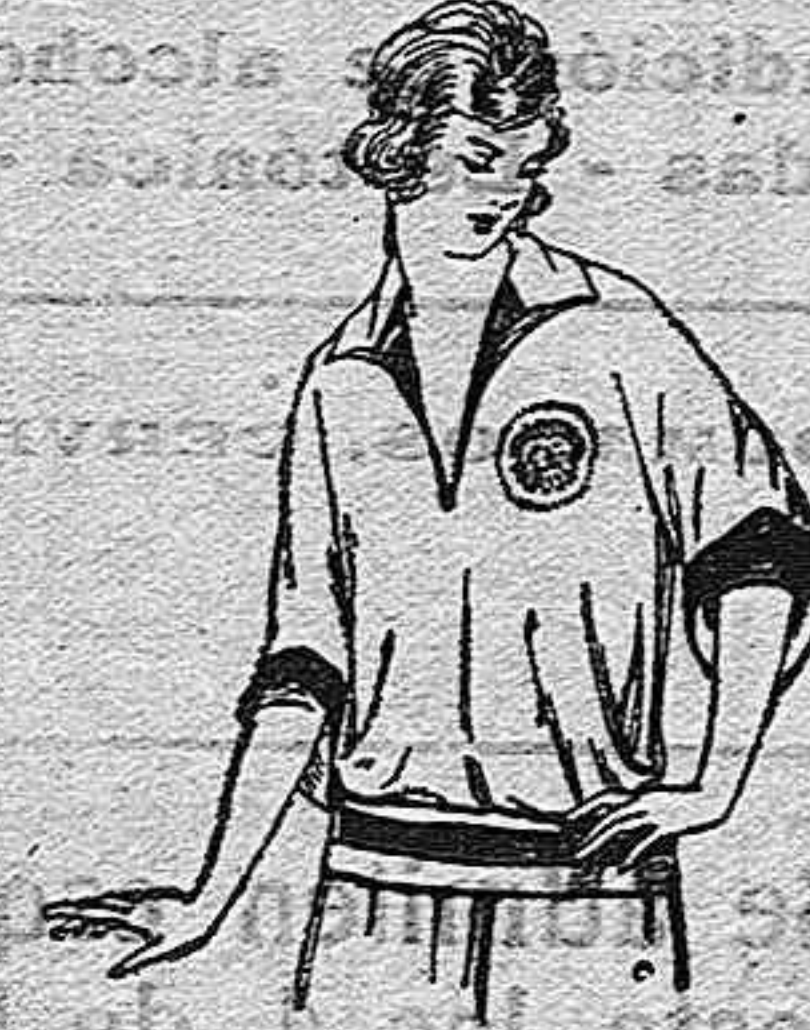
Blusas tricot de seda, en negro y colores de moda a ptas. 30