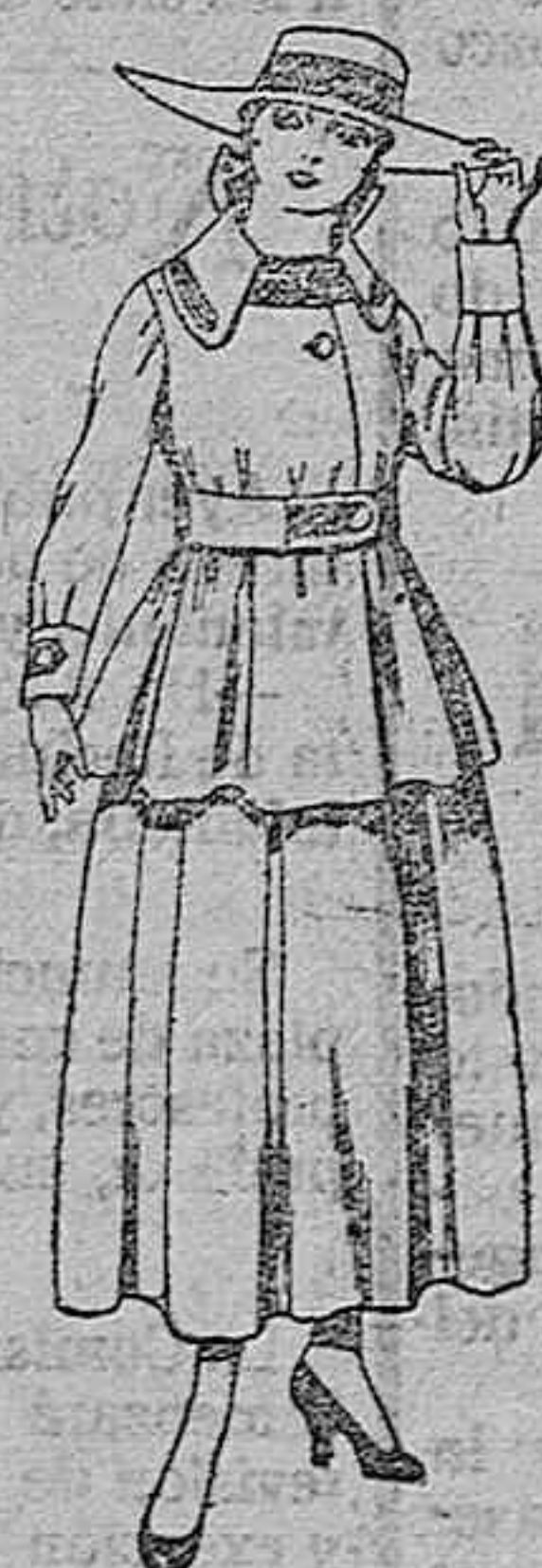
Trajes de lanilla negra, azul y color, para jovencitas de 13 a 16 años. De ptas. 50 a 55.