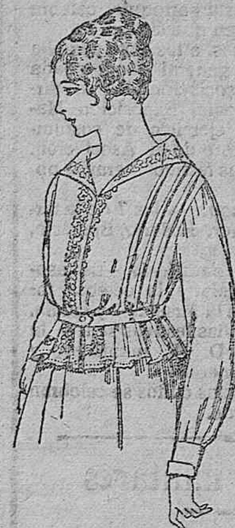
Blusa de voile blanco, bordados blancos, rosa o azul. A ptas. 9.