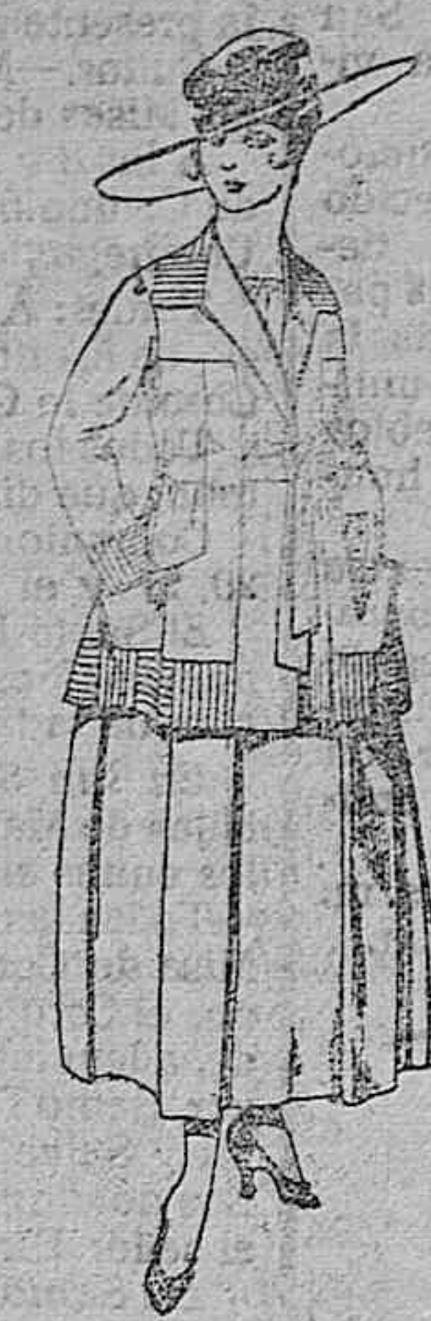
Traje de lanilla negro, azul, y color, bordado, a pesetas 90