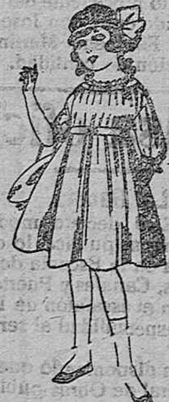
Vestidos de lanilla azul, para niñas de 4 a 9 años. De ptas. 22 a 25. Los mismos en voile. De ptas. 18 a 17.

Servicio fijo, sin escalas, para pasajeros carga entre Barcelona, Almería y Melilla, por el vapor