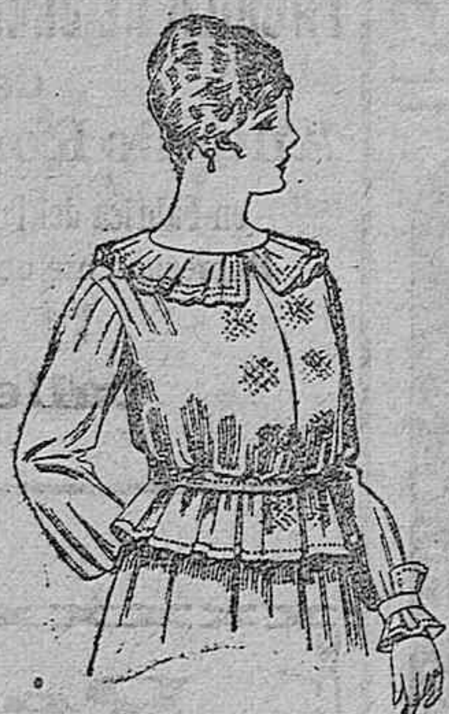
Blusa de crepón o seda, en negro, azul y color. A ptas. 33.