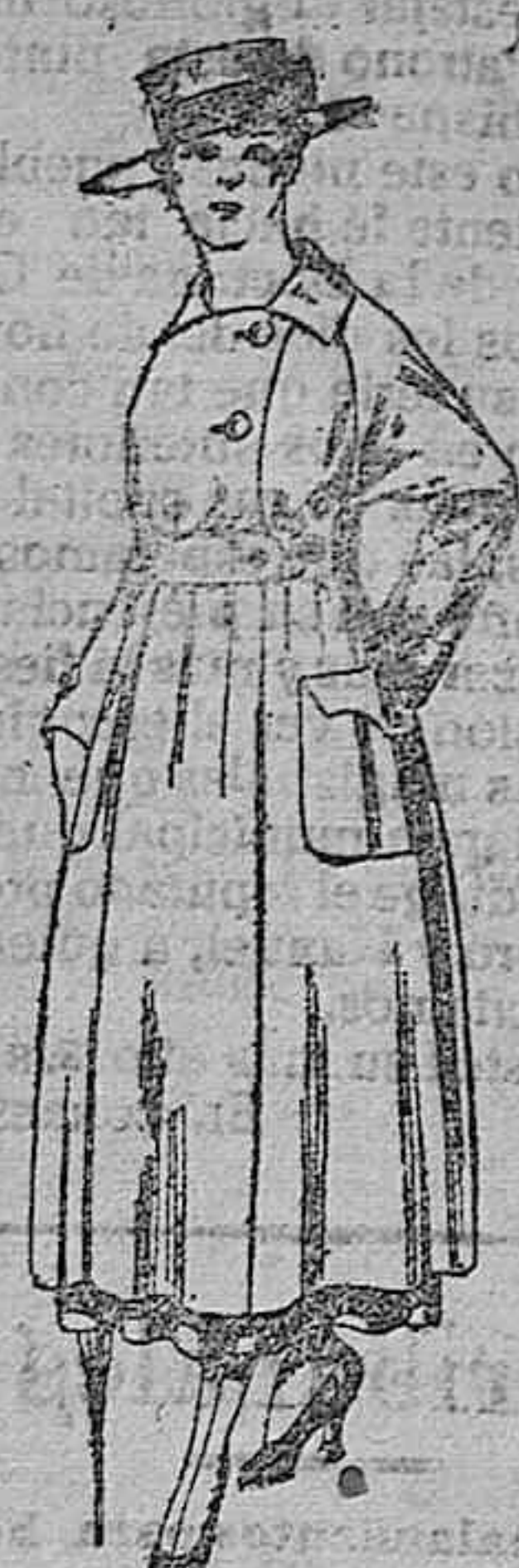
Vestido de estambre negro, azul y color, bordado. De pesetas 64 a 75.