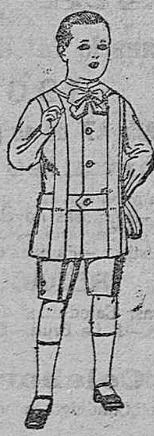
Trajes de lanilla, melton, etc. para niños de 4 a 9 años. De ptas. 16 a 33.