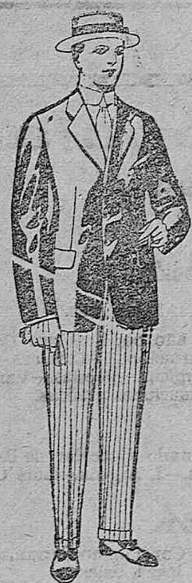
Trajes de lanilla, vicuña, etc. para jovencitos de 10 a 16 años. De ptas. 13 a 33.