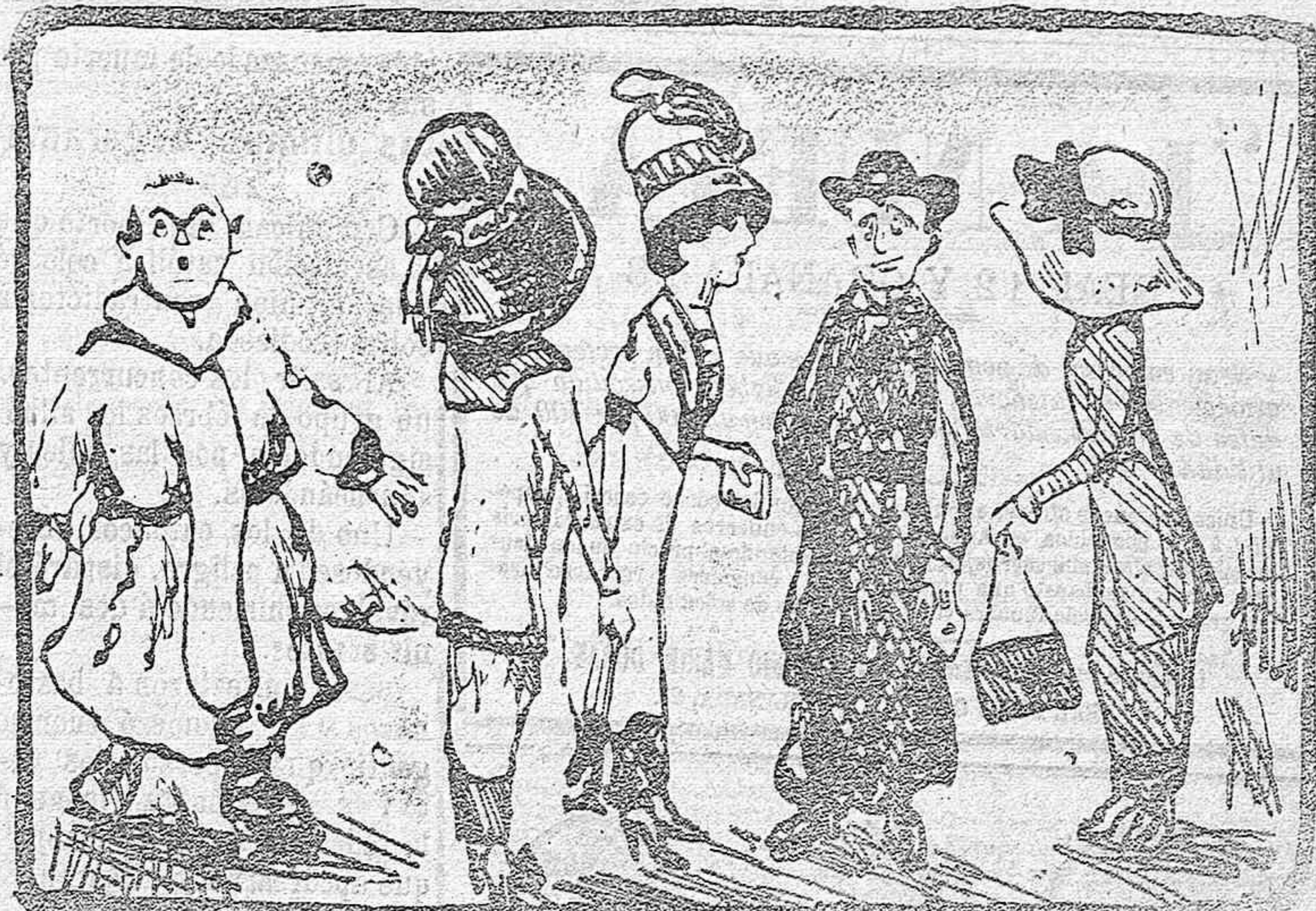
El Jesuita.—Venid conmigo, hijas de María: os ofrezco un corazón inflamado de amor purísimo... El Dominico.—Está visto: es me vá el rebaño...

(HISTORIA DE UN CABALLO) El gran escritor ruso León Tolstói presentó en esta novela originalísima los rudos contrastes que en nuestro tiempo se destacan á veces, con tanta intensidad, entre el ambiente creado por la civilización y el alma de la naturaleza. En este choque se revela el espíritu sencillo y noble de Kolstomero, el caballo, en abierta oposición al de los personajes huma-