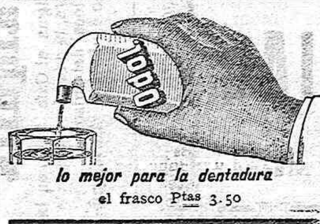
lo mejor para la dentadura el frasco Ptas 3-50