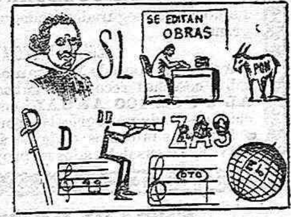
(La solución mañana.)