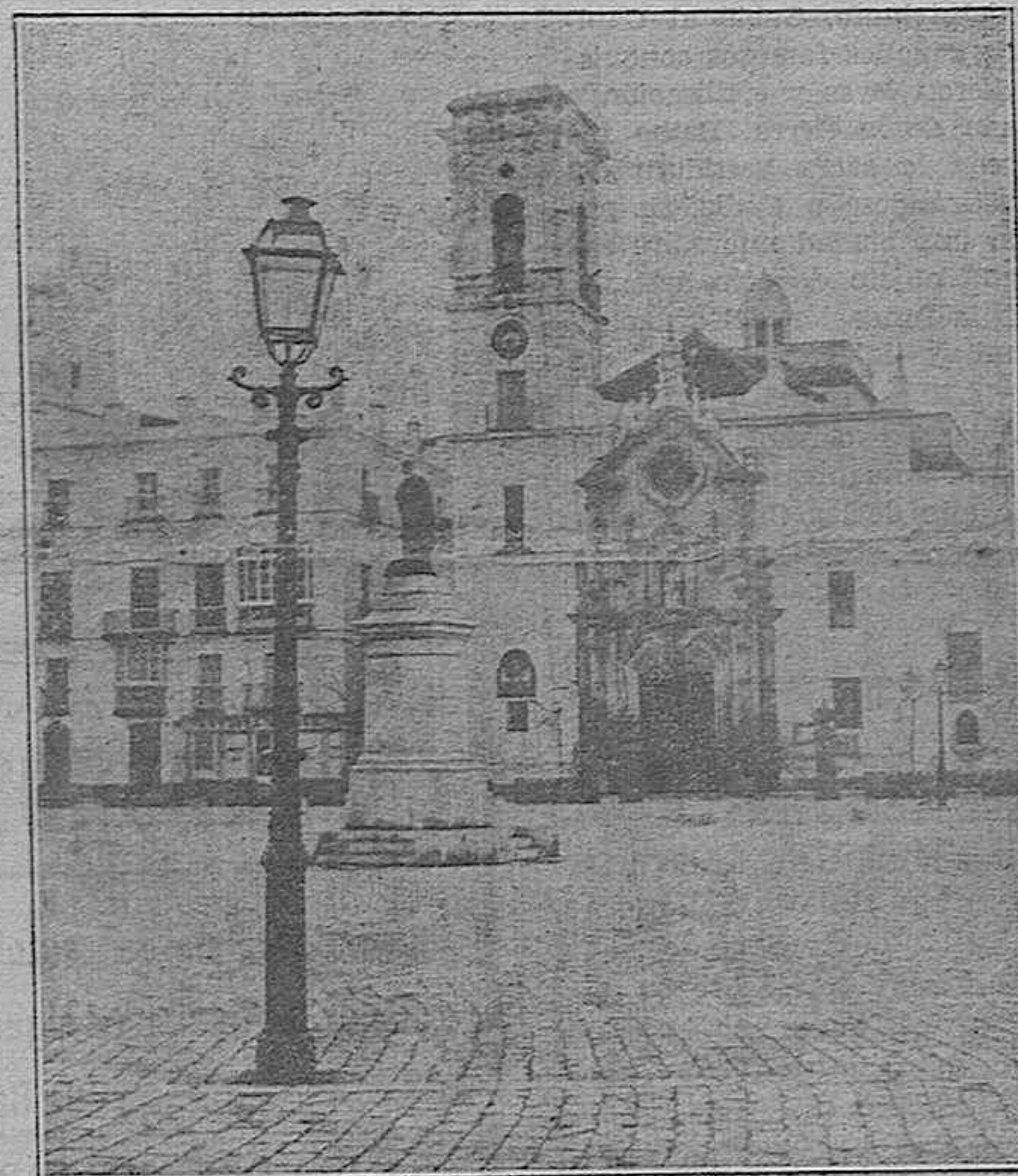
La Plaza de la Constitución y la Estatua de Balbo

Una sorpresa para los lectores será la fotografía que reproducimos de la Plaza de la Constitución en 1855, en la que se advierte a la iglesia de San Antonio con una sola torre (1), y sin cúpula, y en su centro la estatua de Lucio Cornelio Balbo, el Menor, gaditano, primer extranjero que obtuvo en Roma los honores del triunfo (2).