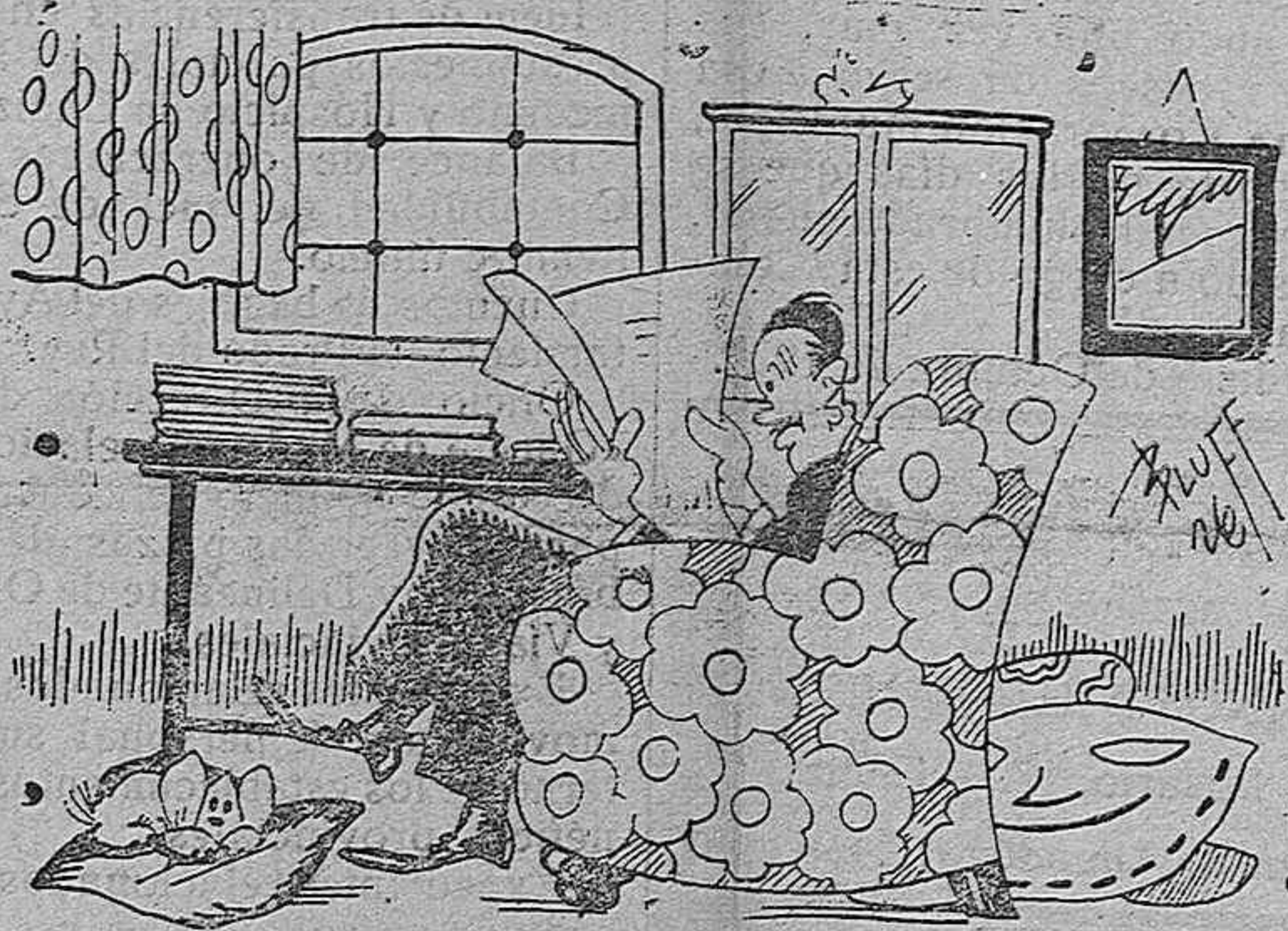
—Pero señor, ¿a qué entrar ahora en el Tercio, si ya Marruecos está tranquilo!

¿Es posible salir airoso de un caso que significa llevar una institución, agena a la disciplina militar, pero que tiene, como ocurre en este somatén local, la disciplina de la cultura, del amor a la institución y de la ciudadanía.