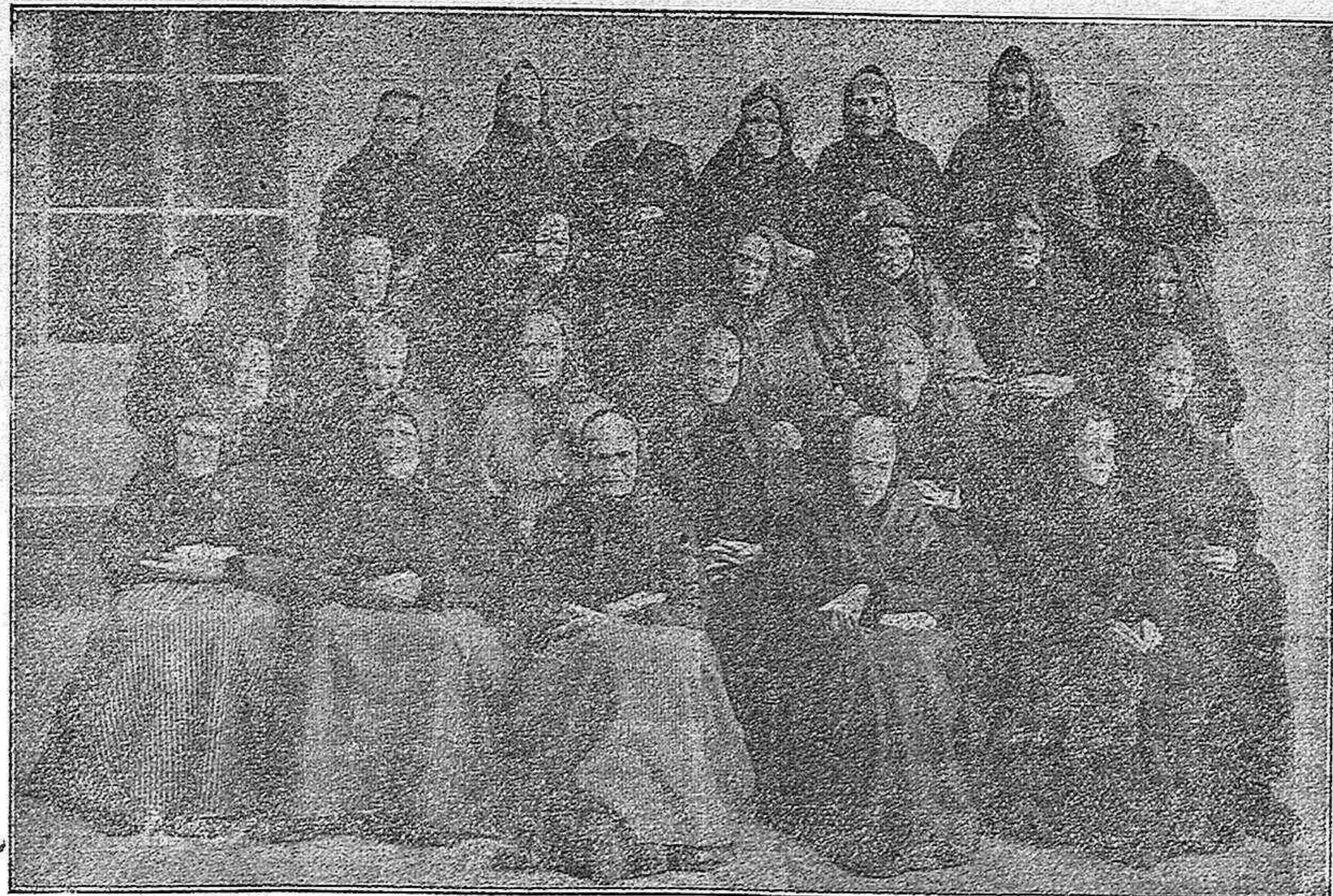
HONRANDO A LA VEJEZ

Asuntos judiciales y administrativos.—Certificados de últimas voluntades y de penales.—Licencias de caza y pesca.—Pasaportes para el Extranjero.—Cuotas Militares.—Gestión de toda clase de asuntos en Ministerios y Oficinas Públicas.