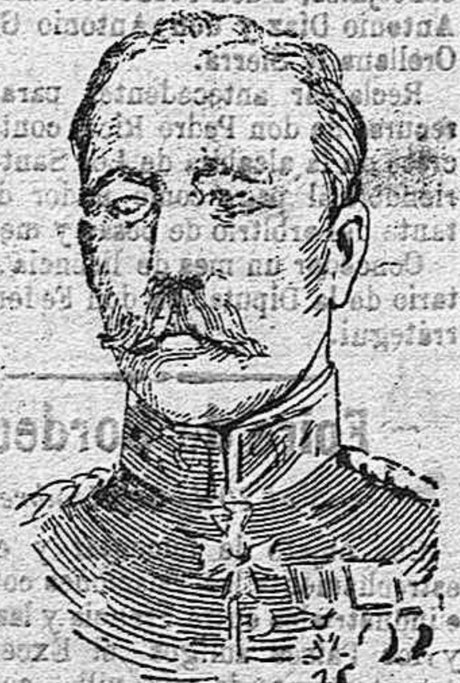
El general Douglas Haig, general en jefe del ejército inglés que ha tomado la ofensiva en la Picardía contra el frente alemán.