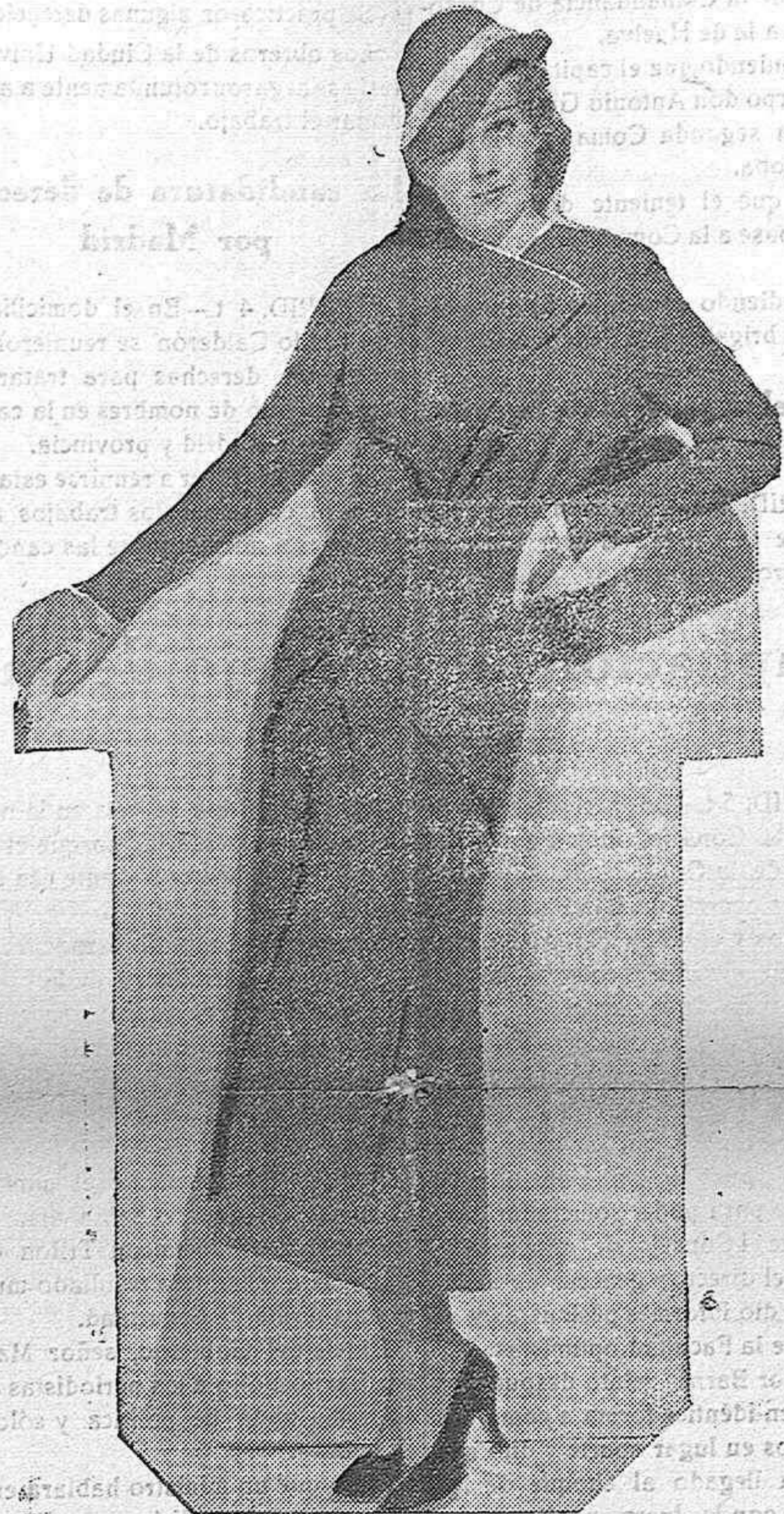
JEAN HARLOW una de las más bellas, elegantes y sugestivas actrices que desde Cine-landia ha conquistado la admiración de los públicos de todos los países. Uno de sus últimos films «Abismos de Pasión», está rodando por el mundo con el unánime beneplácito de la crítica y espectadores.