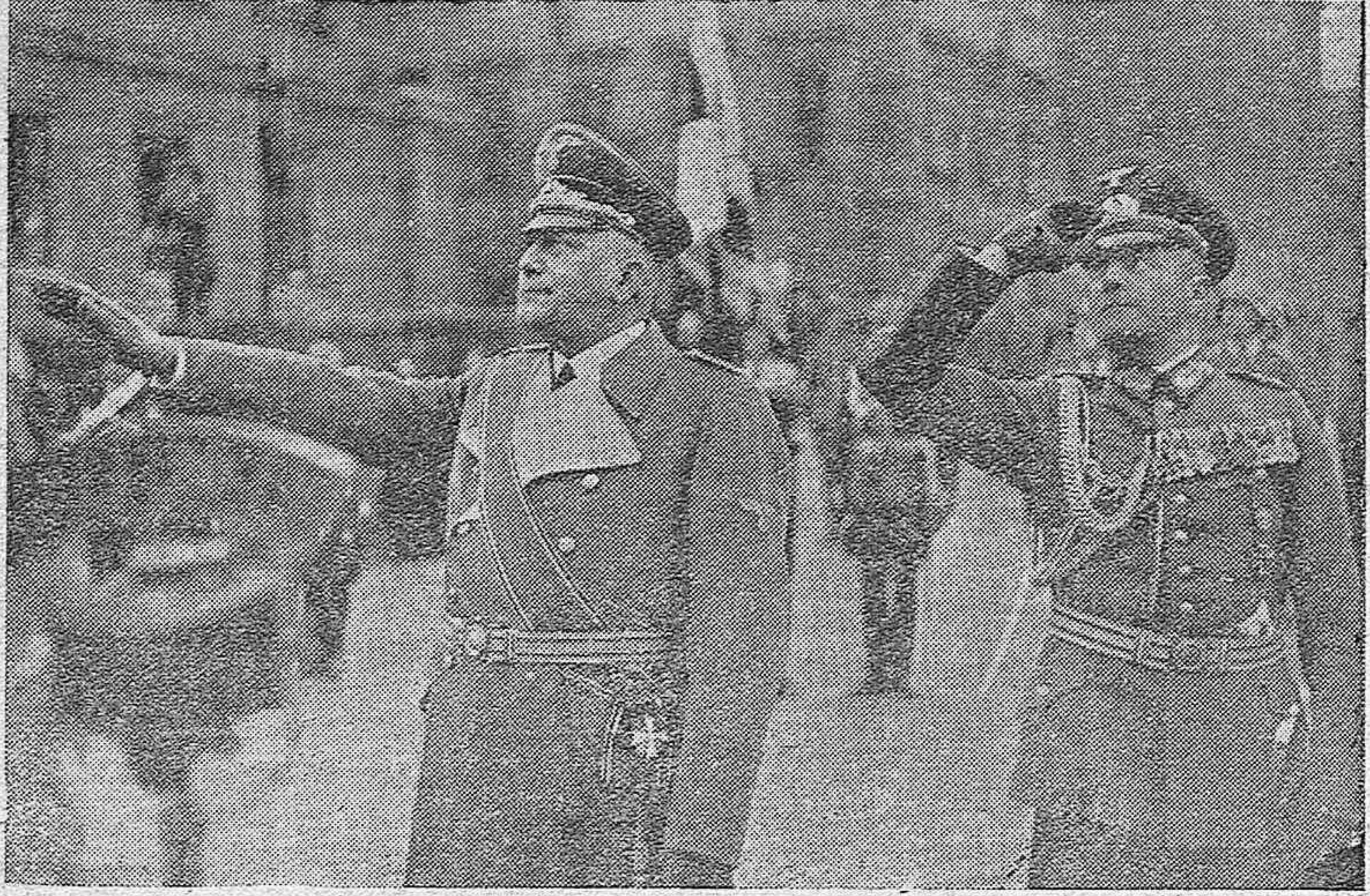
Un detalle del desfile militar celebrado en Praga ante el Presidente del Estado checo, Dr. Hacha y el Protector del Reich para Bohemia y Moravia, von Neurath, con motivo de la toma de posesión de éste.—El Protector del Reich para Bohemia y Moravia, von Neurath, saluda a la bandera del Reich izada en Praga, el día de la toma de posesión de su cargo.