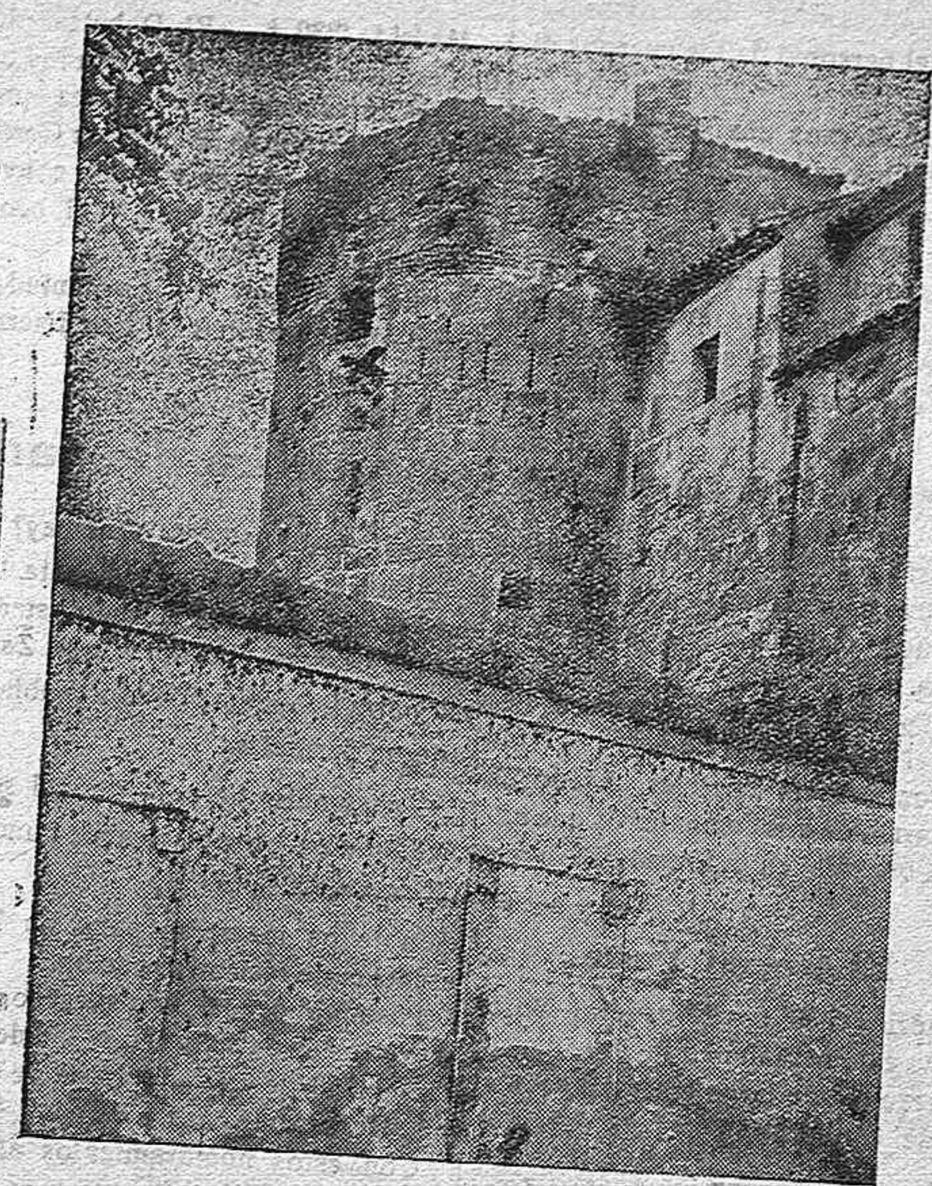
Ventana del torreón por donde se escaparon, deslizándose por una soga, después de haber limado los barrotes y practicar un boquete en uno de los tabiques que dan acceso al mencionado torreón. Dos de los fugitivos han sido detenidos; de los otros tres no se sabe nada de su paradero.