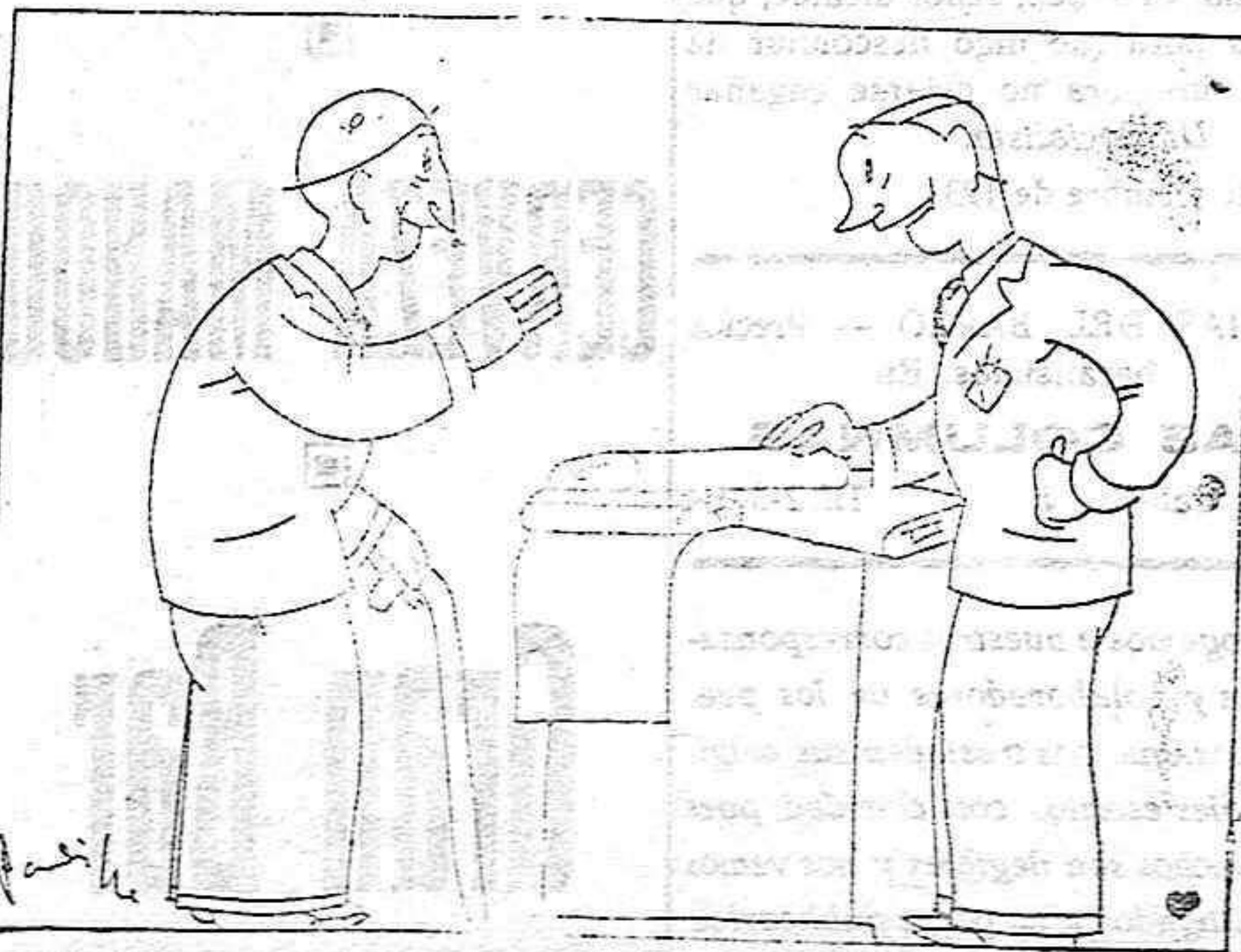
—Sí, hágame usted el traje, pero con cuatro pantalones. —¿Cuatro? —Sí: mi mujer acaba de comprar un perro policía.

Acaba de publicarse: "LA AGRICULTURA SOVIÉTICA MODERNA" por A.-L. Strong.—Precio: 75 céntos. LIBRERÍA LIQUE. — PAPELERIA