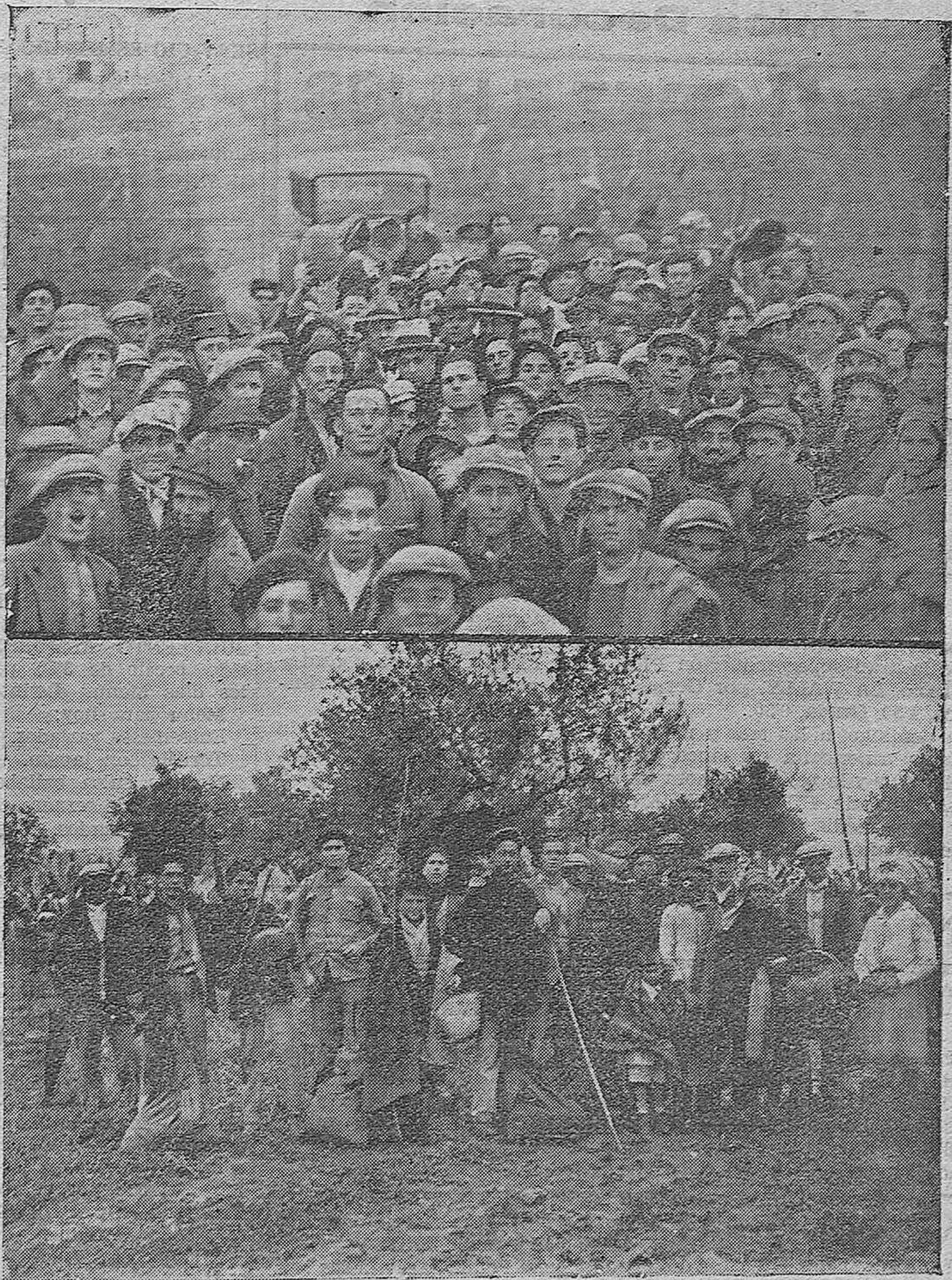
LA ACEITUNA DE LA FINCA "LOS FRAILES".—Las autoridades que fueron a informarse de lo ocurrido, rodeados de un grupo de vecinos que marcharon a hacer la recolección por su cuenta.—Un grupo de improvisados aceituneros con el "fruto de su trabajo de unas horas"