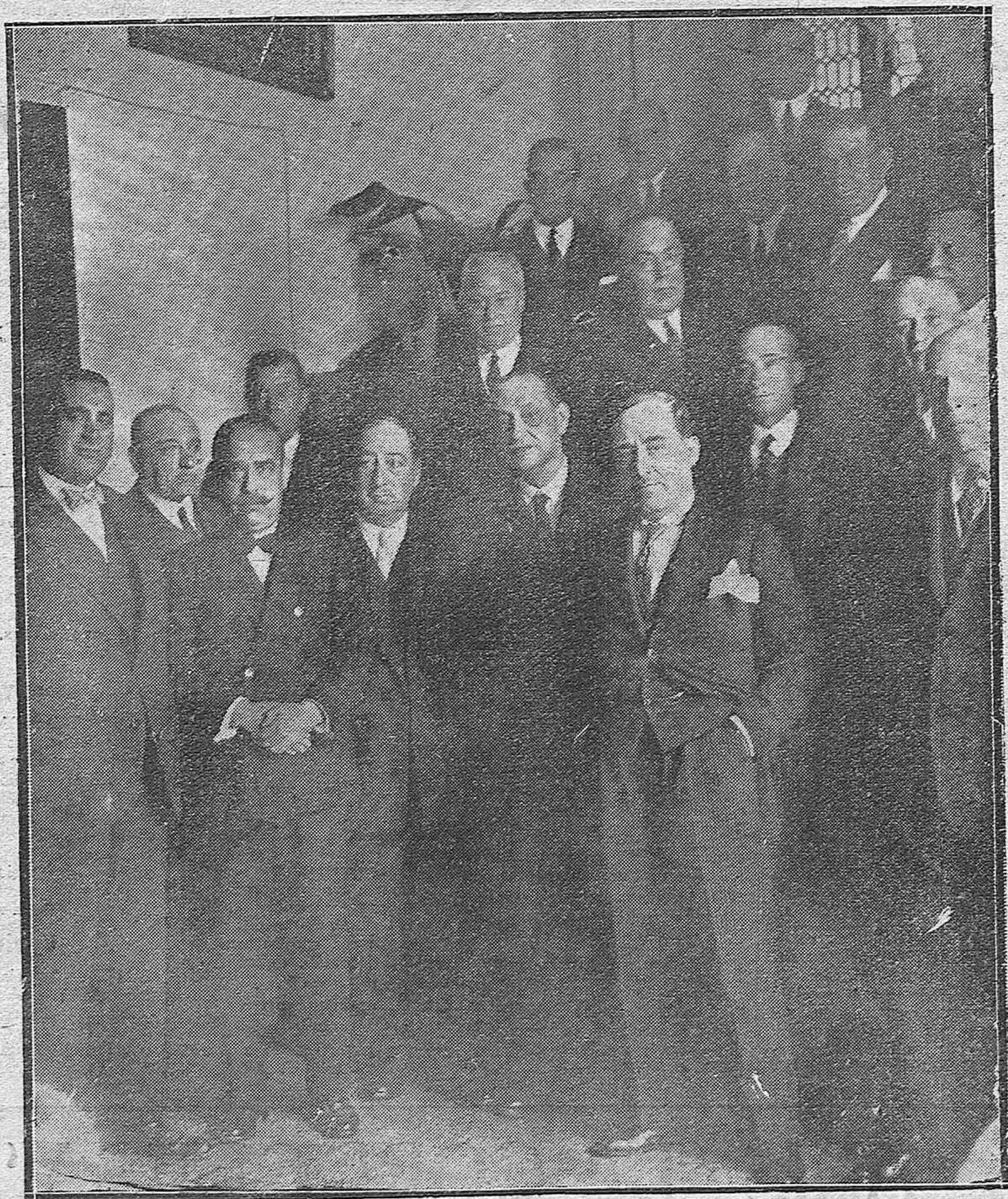
EL GOBERNADOR CIVIL, SR. ATIENZA, CON LOS NUEVOS CONCEJALES, DESPUÉS DE LA CONSTITUCIÓN DEL AYUNTAMIENTO.