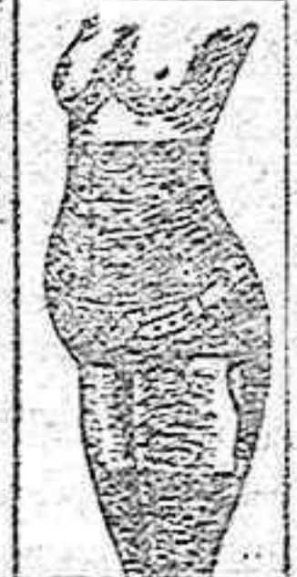
CORSET DE PRECISION

sin operación ni molestia con el herniario IDEAL MORA, última creación de la Ortopedia moderna. La segura eficacia de este aparato es un remedio radical para curar toda clase de Hernia (Quebraduras), por rebeldes y voluminosas que sean, incluso las reproducidas después de la operación.