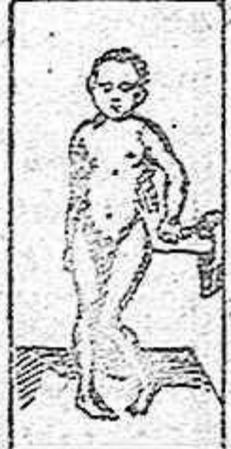
ENFERMEDAD DE LITTE