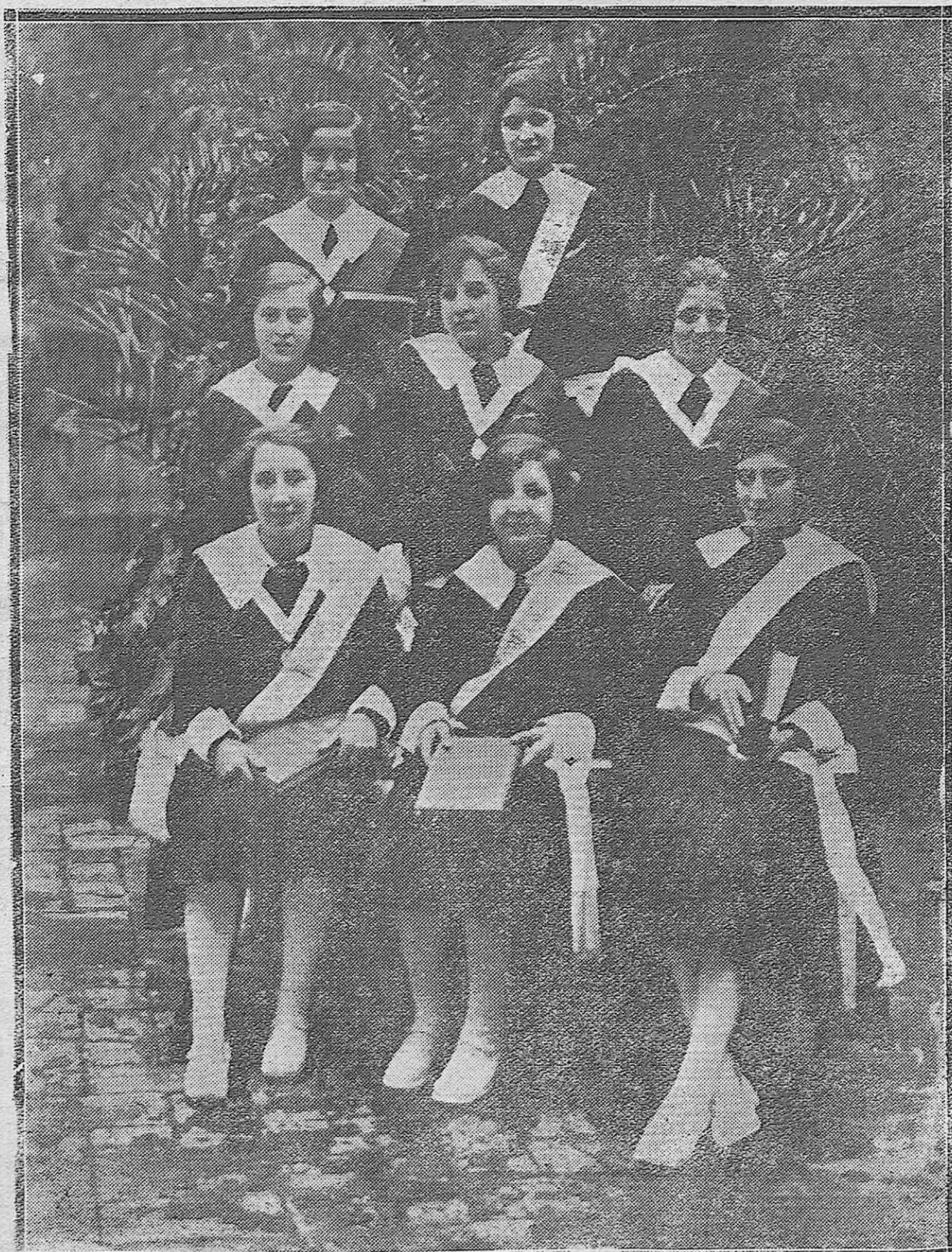
CÓRDOBA.--Grupo de alumnas del Colegio de Santa Victoria, que han obtenido Premio de honor en su respectivo curso.