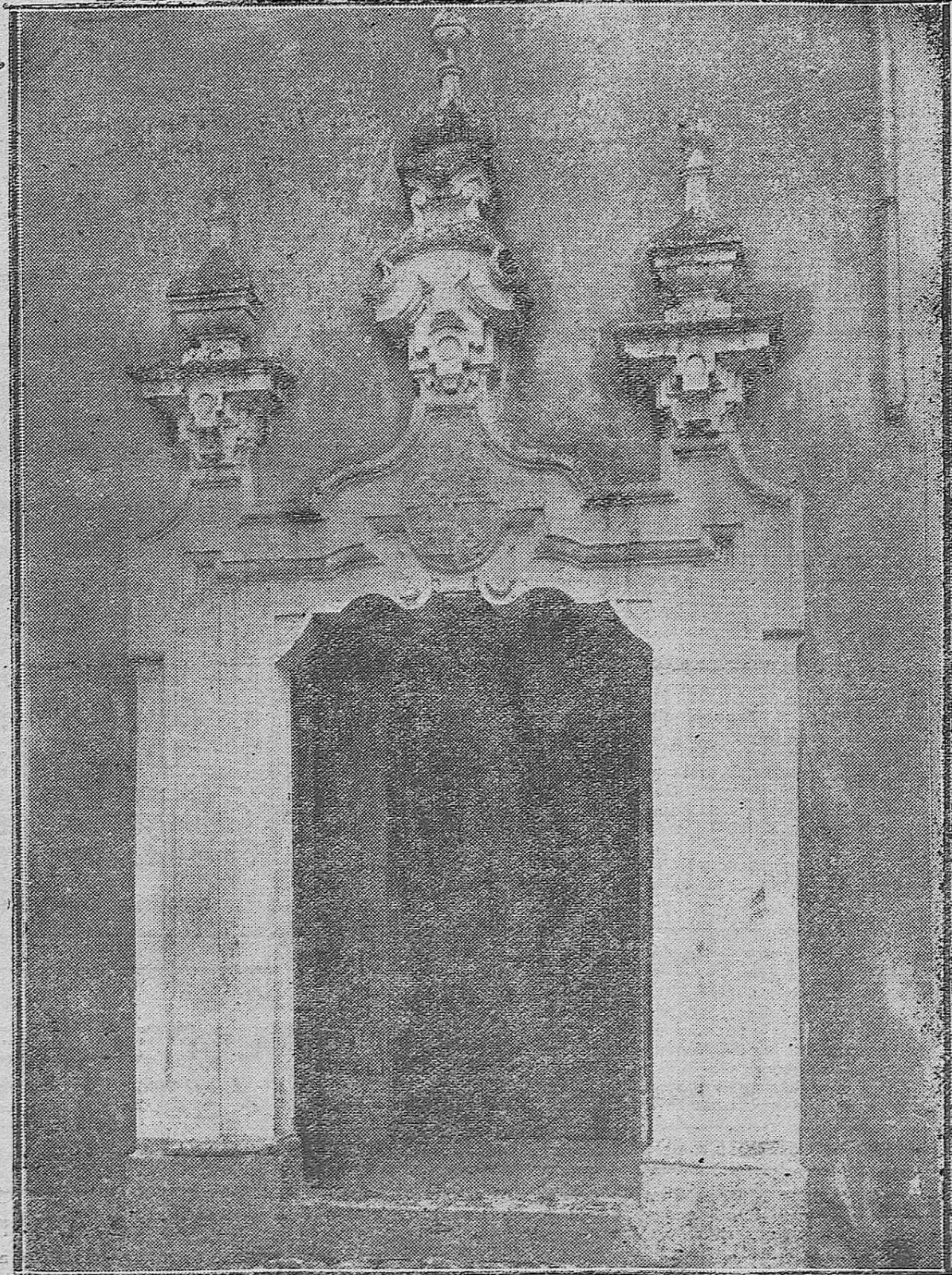
CÓRDOBA MONUMENTAL. -Portada barroca que comunica los claustros de la Real Colegiata de San Hipólito con la calle de la Alegría.-En su dintel campean las armas de España que acreditan que aquel edificio perteneció al Real Patronato.