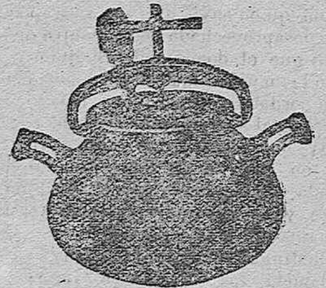
Marmita Hispano-Olla Exprés

Batería de cocina - Herrajes para obras y herramientas en general