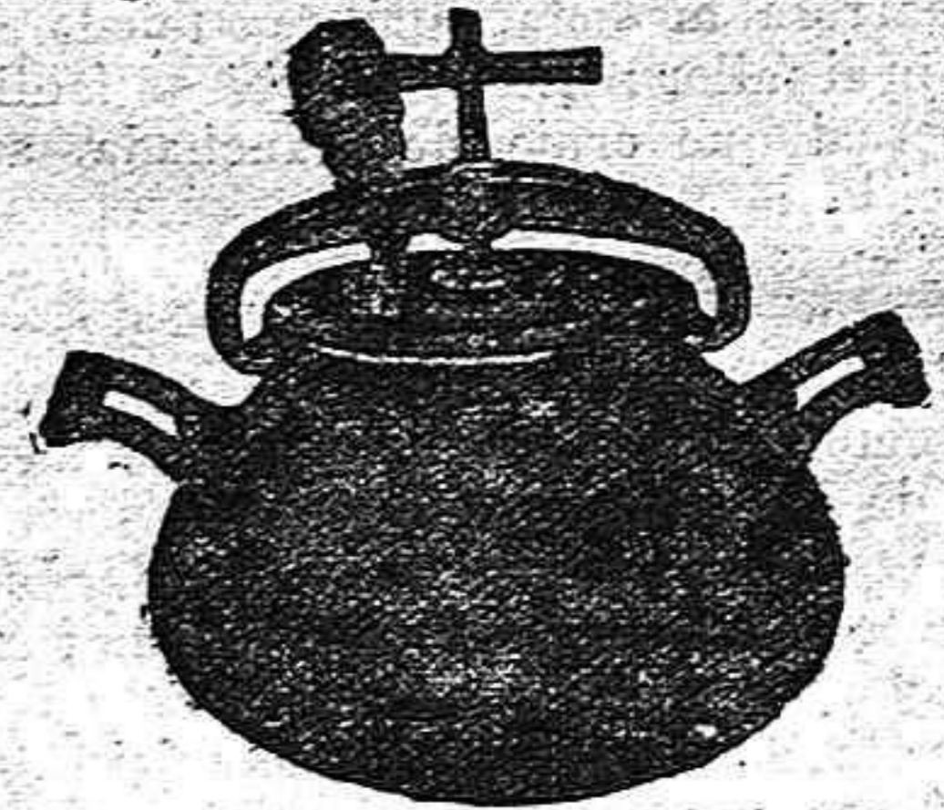
Marmita Hispano-Olla Expres.

Batería de cocina - Herrajes para obras y herramientas en general