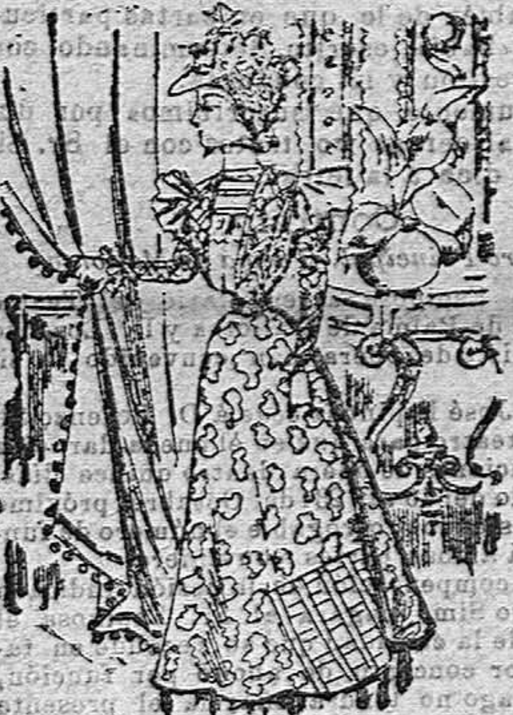
Traje de visita

El bonito vestido que damos a conocer a nuestras lectoras es de batista con motitas. Cuerpo en forma de blusa, de lillón blanco y tres tiras de entredós; torera de batista con solapas; cuello alto y golilla de gasa; mangas al bisé y falda acampanada con tres volantes en el borde.