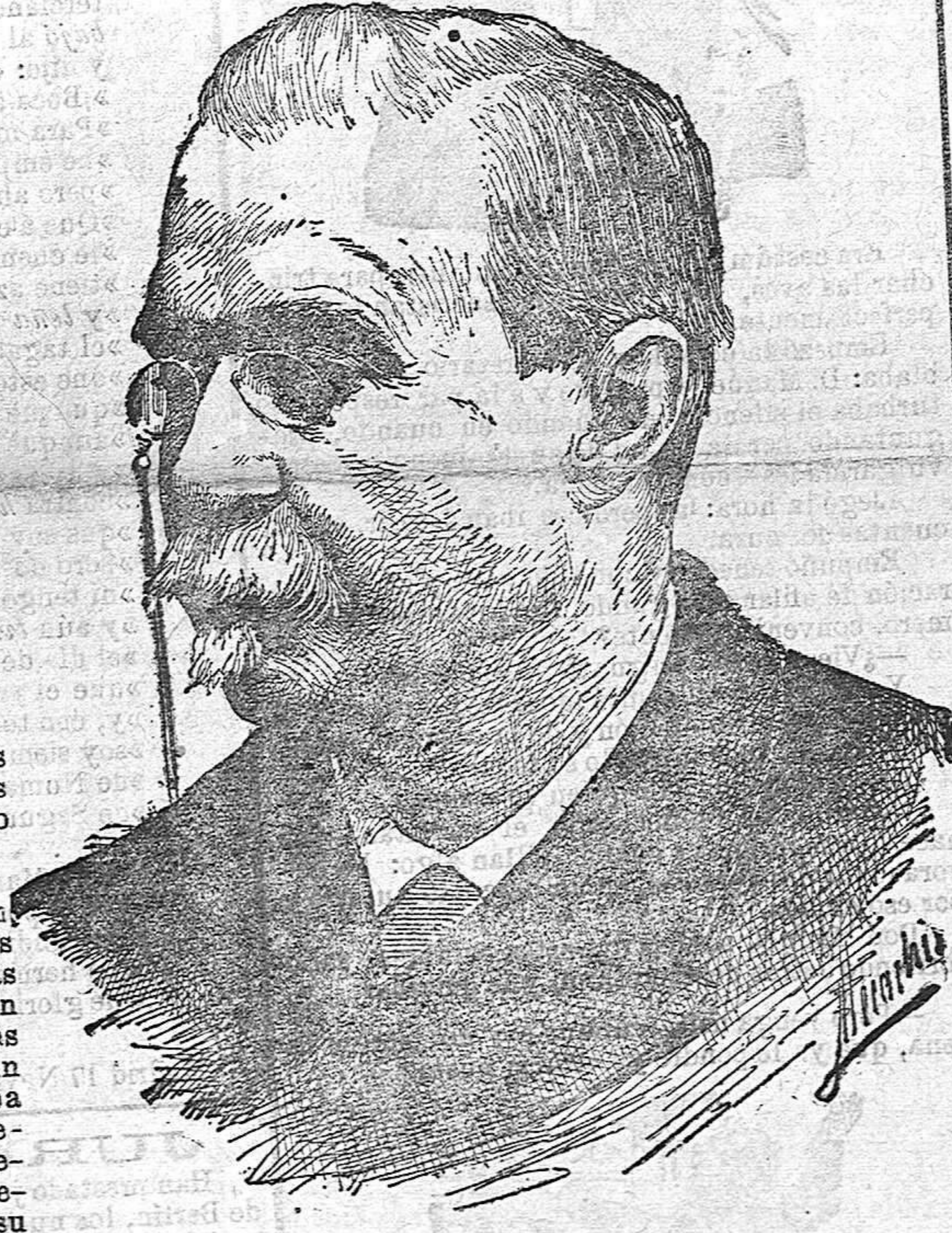
A C6novas del Castillo.

Visto en el apogeo de su grandeza; abandonado a los arrebatos de aquella tempestuosa elocuencia que tiene mucho del ruido del trueno y abraza como el rayo; en medio de una mayor6a sumisa y obediente, parece un sacerdote 6 un or6culo; rodeado de los Apsaras, silfos cuyos cantos alegraban la corte de la India, 6 diciendo a los alegres levitas con la mirada: «Protern6os sus fan6ticos levitas con la mirada: «Protern6os ante mi genio y que lleguen a mis o6dos, como ante mi genio y que lleguen a mis o6dos, como de rezo ferviente, las palabras de la lisonja, m6s olorosas que el incienso y la mirra. Visto en la desgracia, en el Congreso est6 en su templo, pero fuera del tabern6culo. Recuerda esos santos a quienes bajan de su altar para retocarlos y los abandonan en el suelo. Tienen grandeza, arte, santidad, todo... todo menos la devoci6n que en el altar inspiran.