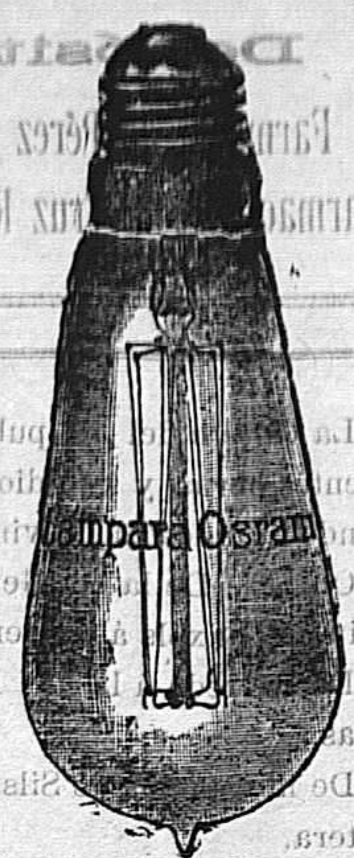
Exíjase la marca OSRAM grabada en el cristal

Tenemos á disposición de nuestros clientes certificados de los mejores Laboratorios y múltiples referencias que comprueban las buenas cualidades de la lámpara OSRAM