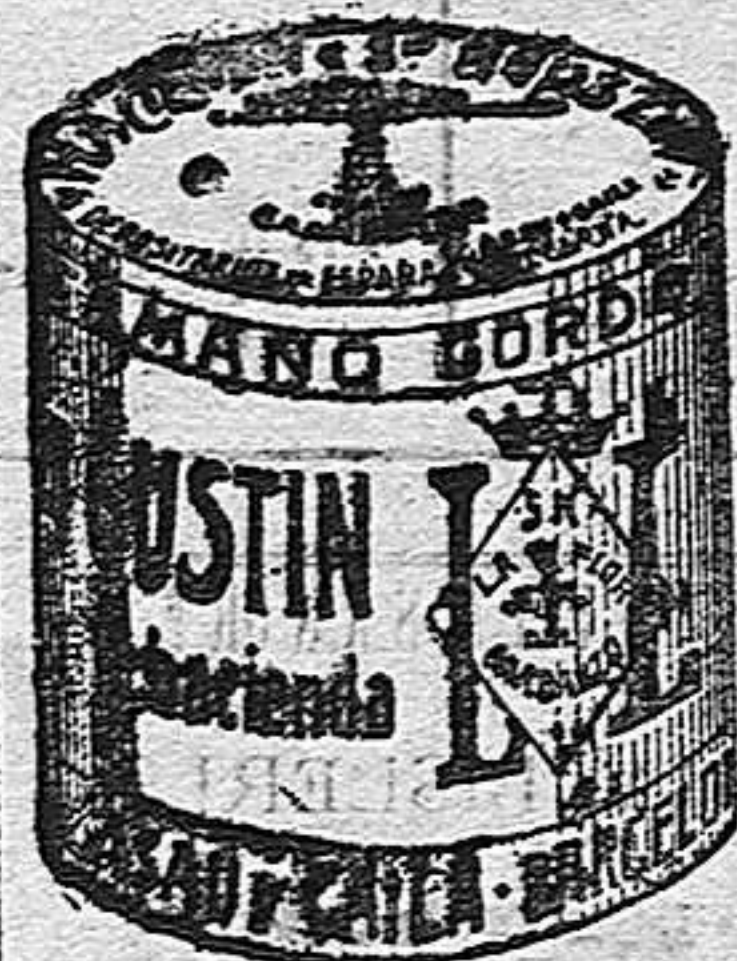
Garbanzo Blanco (5 Kilos)