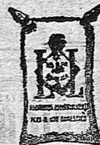
Maana Frapas (1 Kilo)