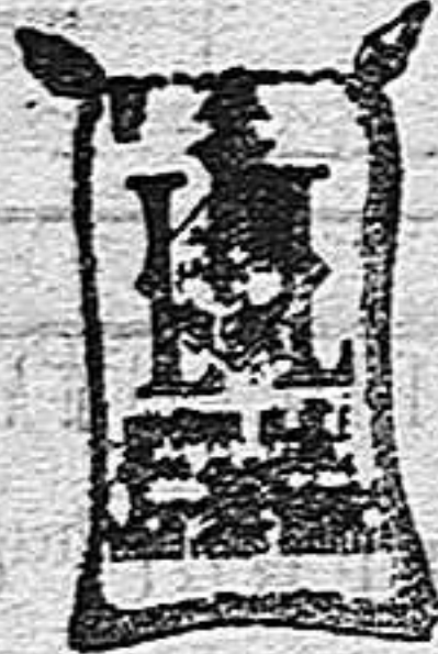
Arroz Glacé (1 Kilo)