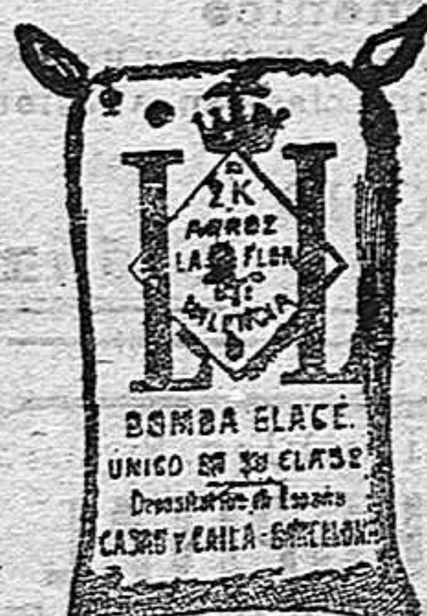
Arroz Glacé (2 Kilos)