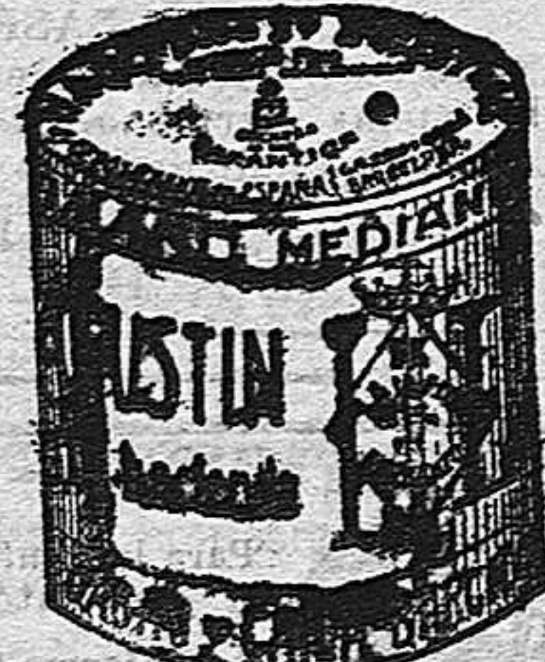
Garbanzo Sauce (5 Kilos)

Garantizamos al público que los comestibles empaquetados con nuestra marca son naturales de la planta, y sin contener la más pequeña adulteración en beneficio de ellos ni para hermosearlos, por lo cual nos hacemos responsables á todo análisis que quiera efectuarse.