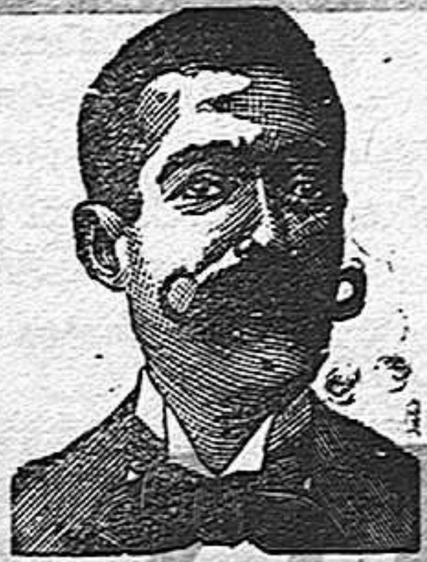
Inventor de los renombrados medicamentos COSTANZI . — Diputación 435. — Barcelona.