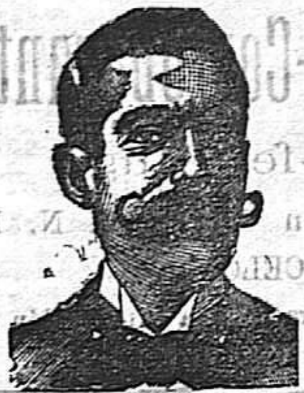
Inventor de los renombrados medicamentos COSTANZI . — Diputación, 435. — Barcelona