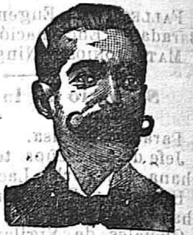
Inventor de los renombrados medicamentos COSTANZI . — Diputación 435. — Barcelona.