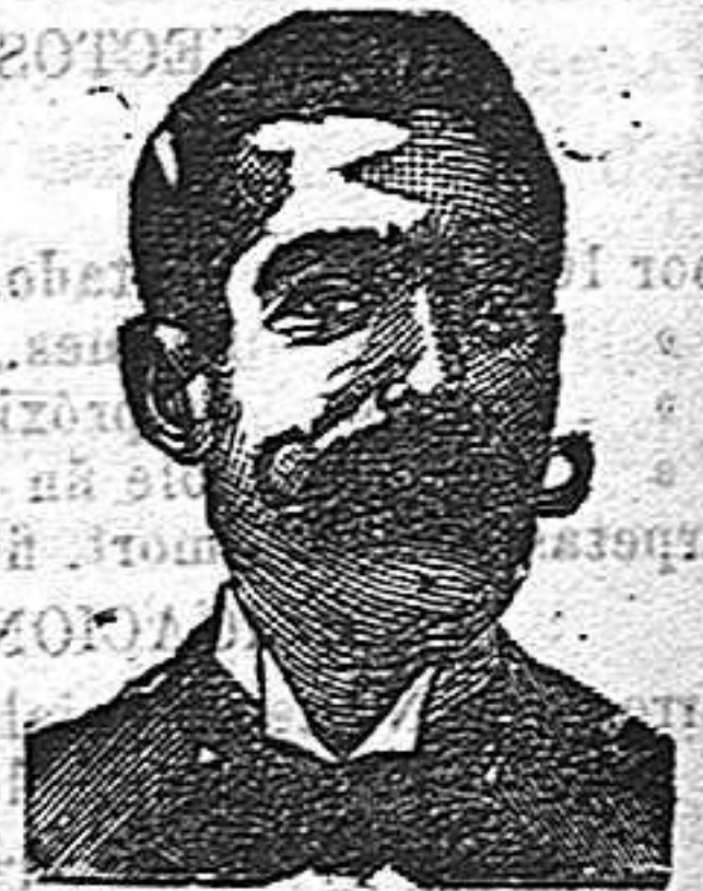
Inventor de los renombrados medicamento COSTANZI . — Diputación 435. — Barcelona