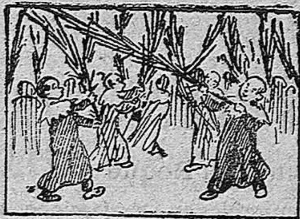
La solución en el próximo número.

Solución á la Charada en acción EMPRESARIO.