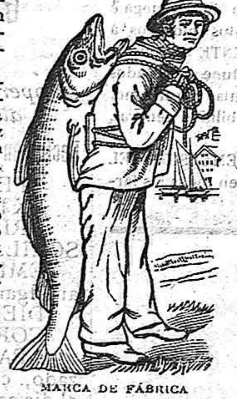
MARKA DE FABRICA