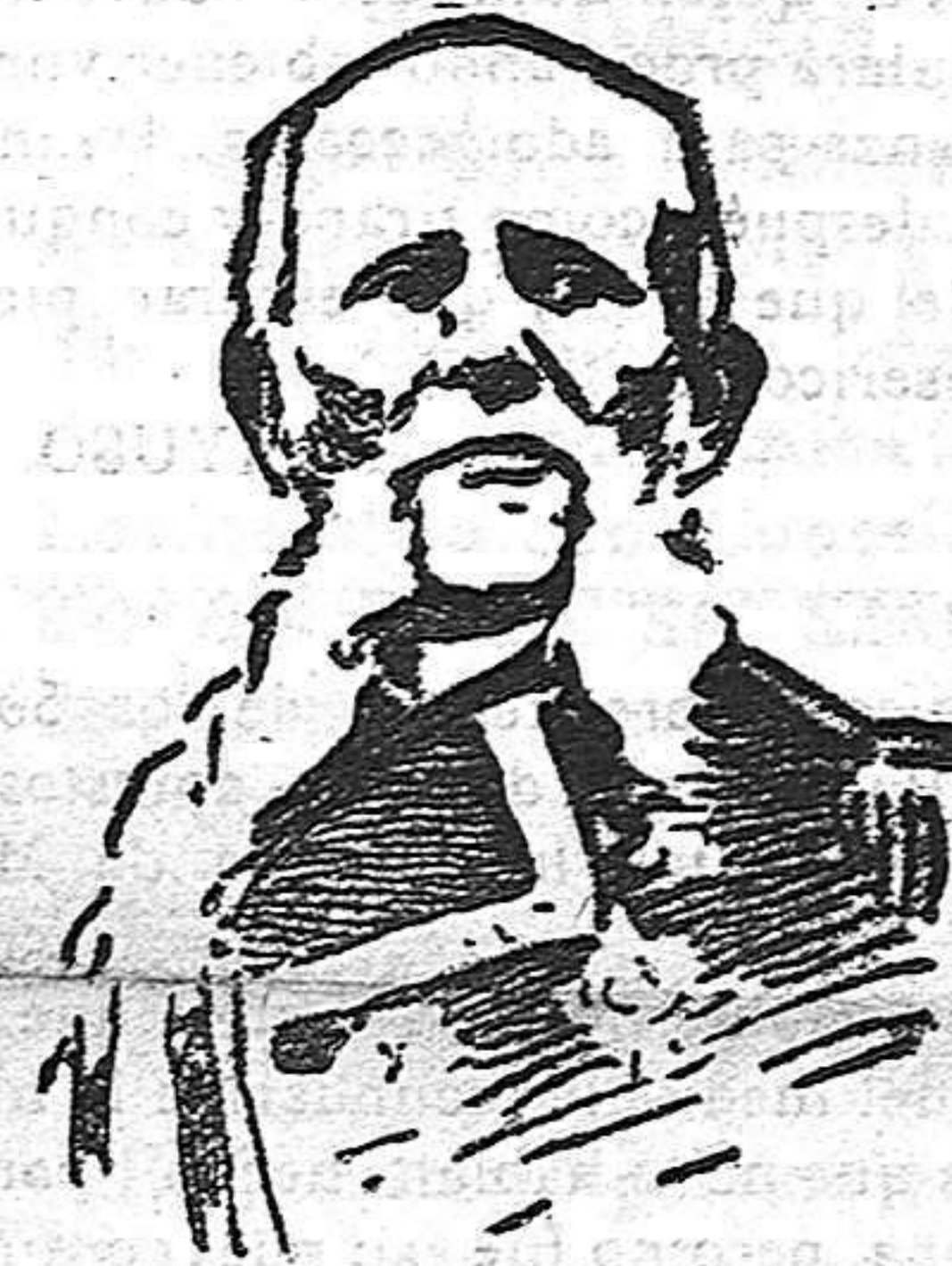
EL GENERAL PUENTE

Sin embargo, el asunto no ha perdido más que en una pequeña parte su gravedad; pues si delictivo en alto gra-