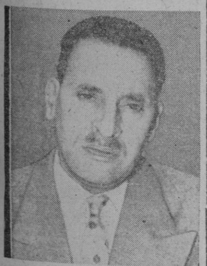
Ferhat Abbas, jefe del Gobierno argelino en el exilio, que acaba de rechazar las ofertas de De Gaulle sobre conversaciones para tratar de poner fin a la guerra en Argelia