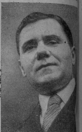
Andrei Gromyko, ministro de Asuntos Exteriores, quien con un nuevo ultimátum, propuesto en Ginebra, parece haber condenado al caso a la Conferencia que se celebra en aquella capital sobre el problema alemán.

Ginebra, 10.—En tanto que todos los ministros occidentales se reúnan en aquella capital sobre el problema alemán.