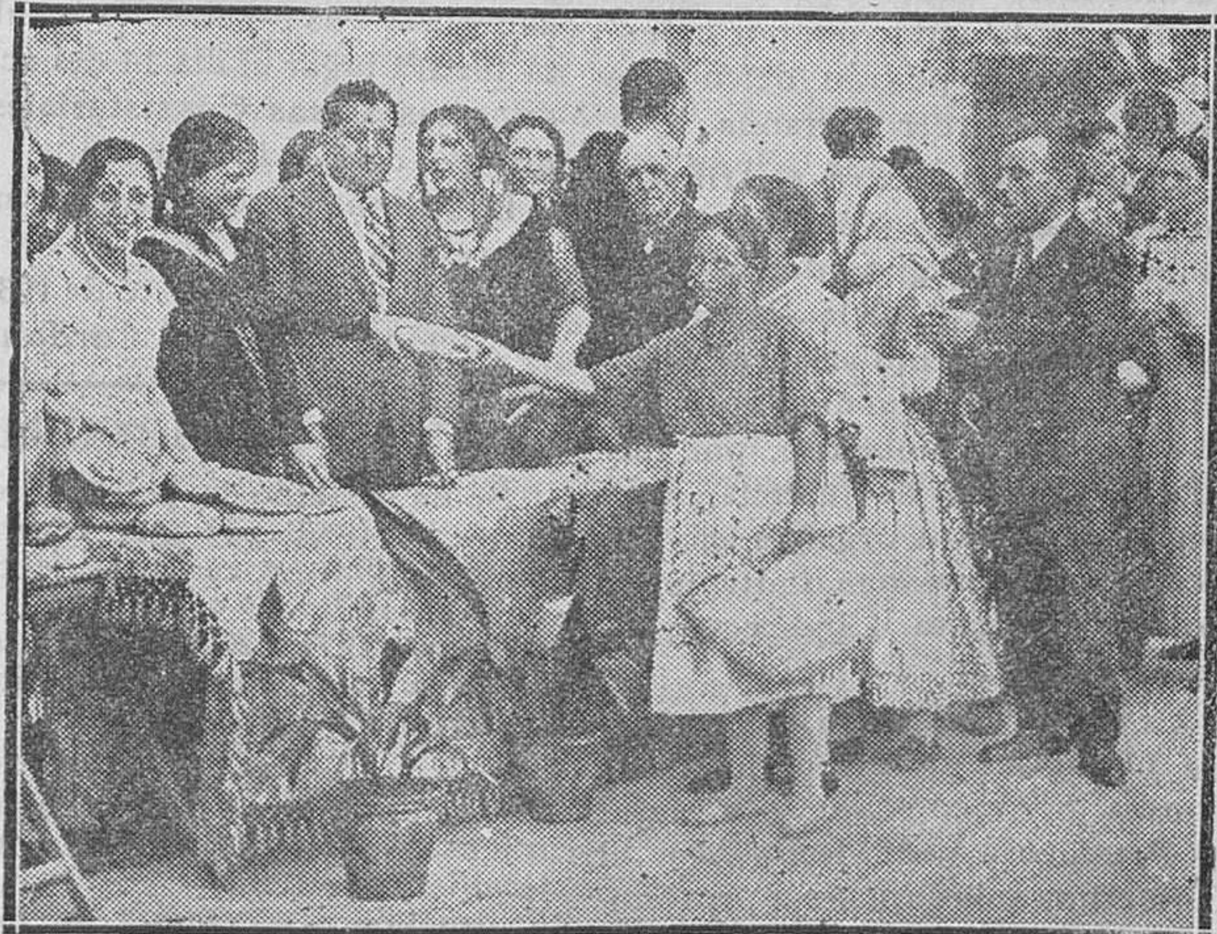
MADRID.—Reparto de bonos a los pobres del distrito del Centro con motivo de los festejos allí celebrados

La Asamblea plenaria entenderá en los siguientes asuntos: 1.º Responsabilidad exigible al Presidente de la República, al Gobierno, al Presidente del Tribunal Supremo, al Pleno del mismo y a los indivi-