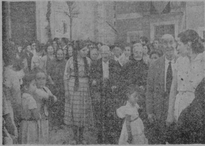
En la populosa barriada de La Soledad, el domingo pasado se celebró un brillante homenaje a la Vejez, del que nuestra foto capta un momento frente a la iglesia parroquial.