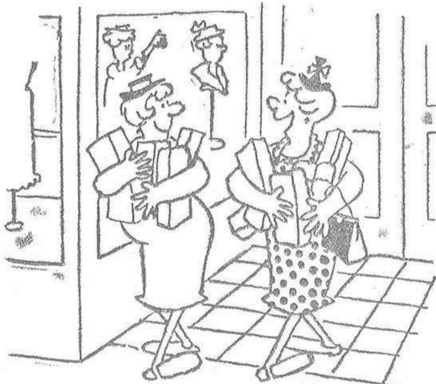
—Estoy deseando llegar a casa para ver qué es lo que he comprado.