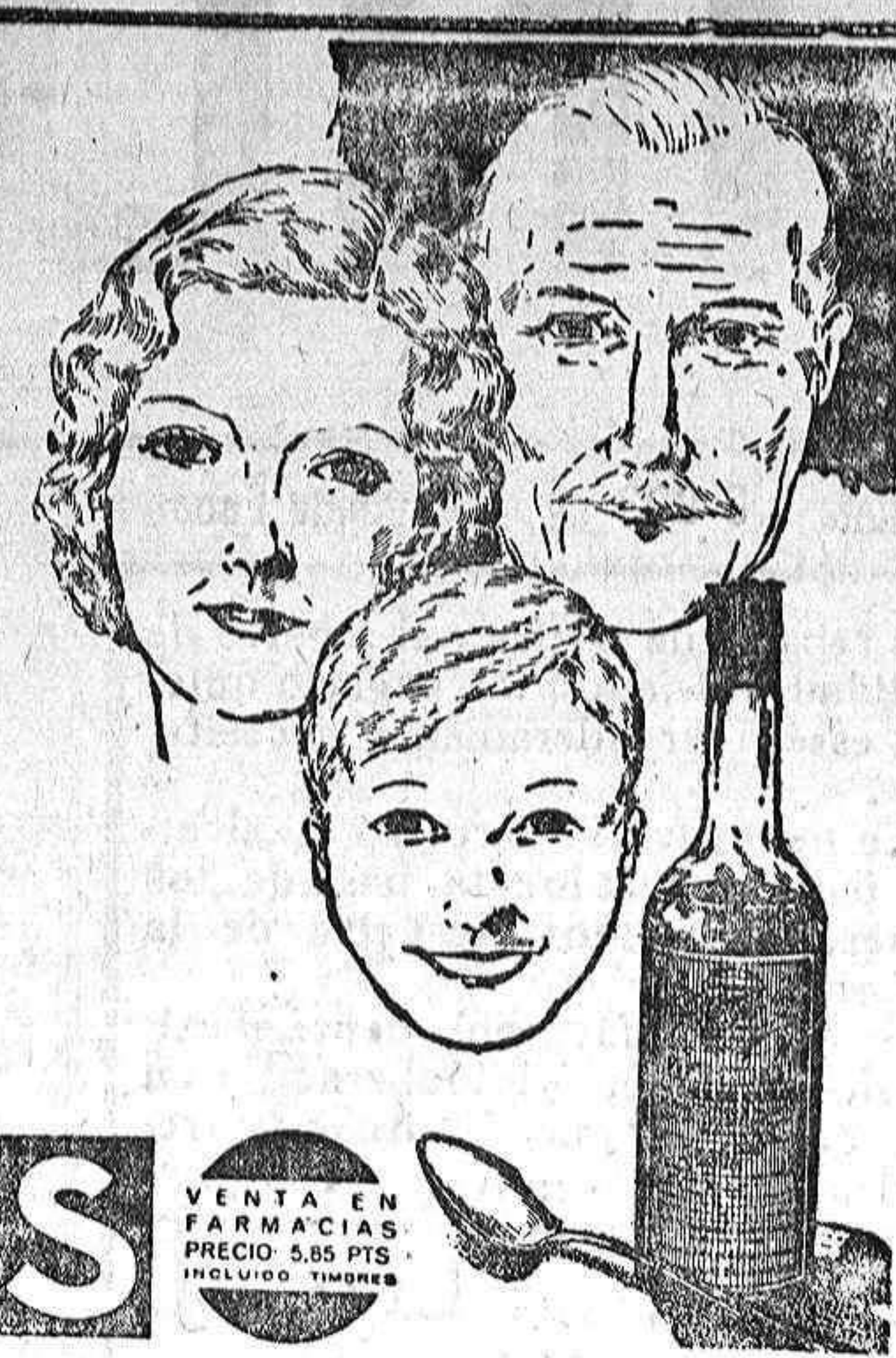
VENTA EN FARMACIAS. PRECIO 5,85 Ptas. INCLUYENDO ENVASE.