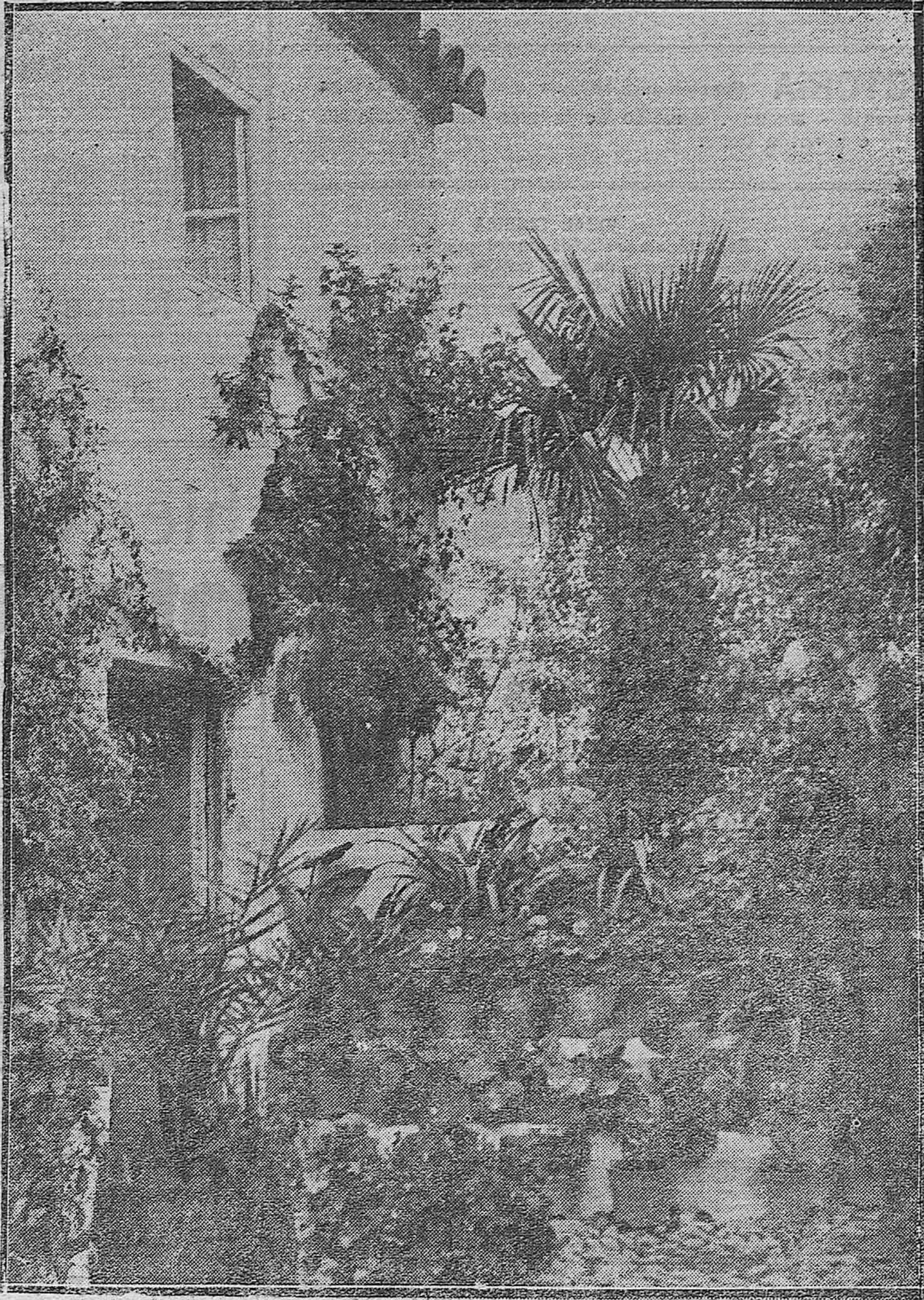
LOS PATIOS CORDÓBESES.—UNO DE UNA CASA DE VECINOS DE LA CALLE DE ESCARUELA.