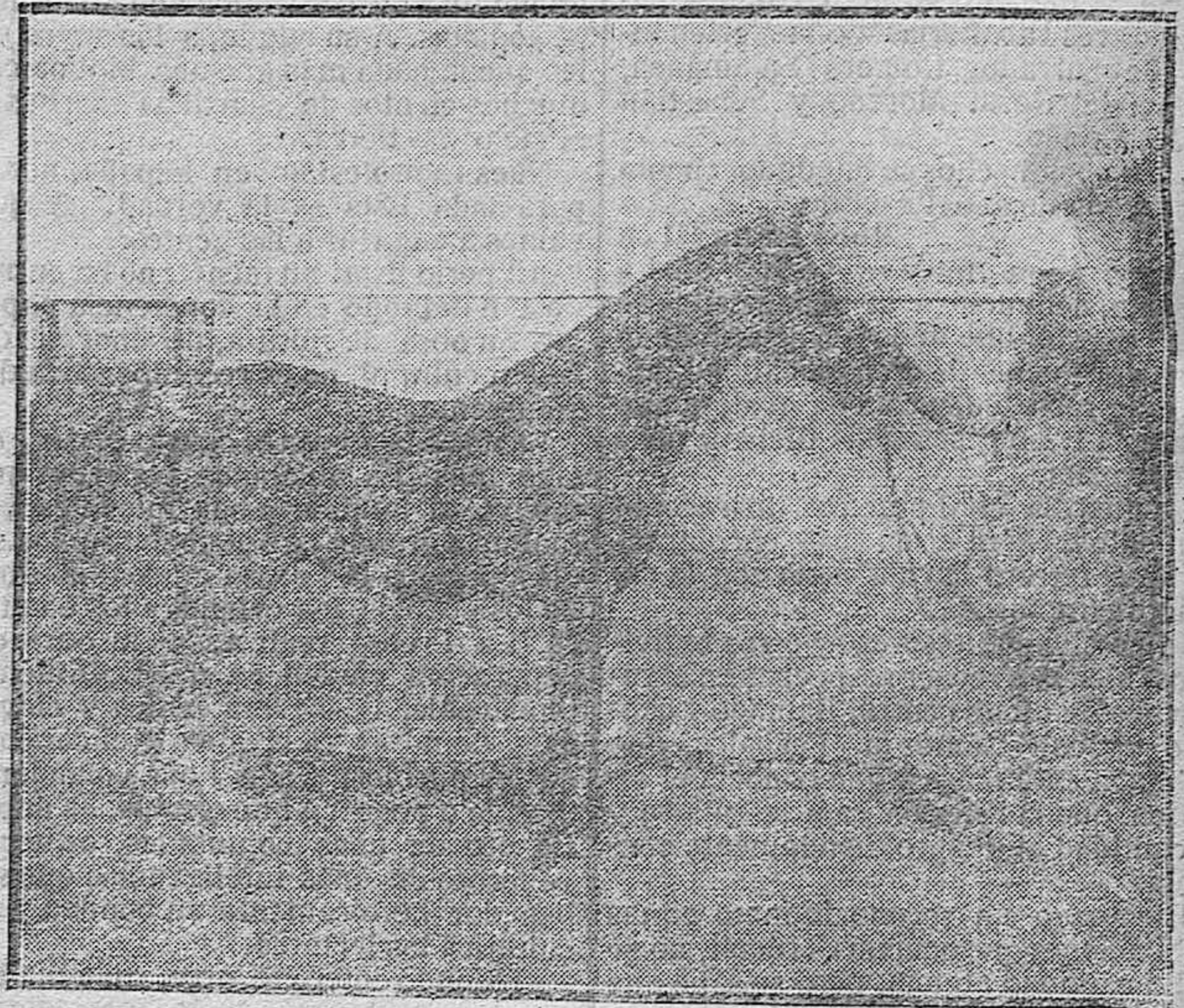
“CLOVIS II”, SEMENTAL ANGLO-ARABE AL 50, PROPIEDAD DEL ESTADO.

Es tan difícil de curar esta Mamitis que muchos autores recomiendan incluso el sacrificio de las vacas atacadas. Por lo menos exigen los animales un intenso tratamiento, bajo la escrupulosa vigilancia de un veterinario.