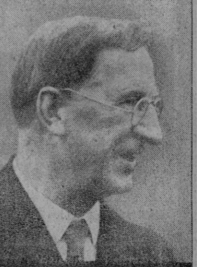
Eamon De Valera