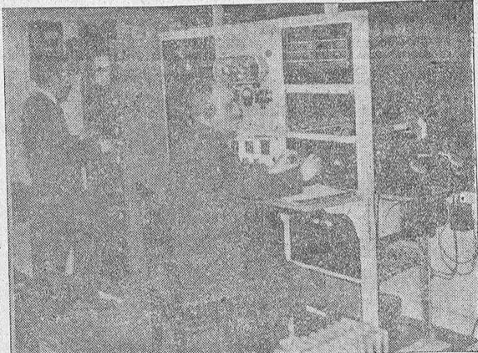
El control en pleno funcionamiento