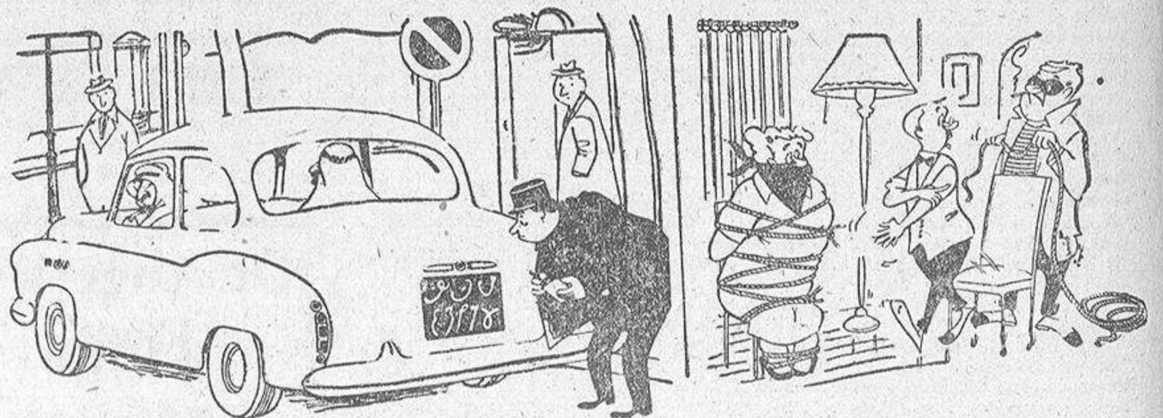
—No hay manera de entender esta matrícula